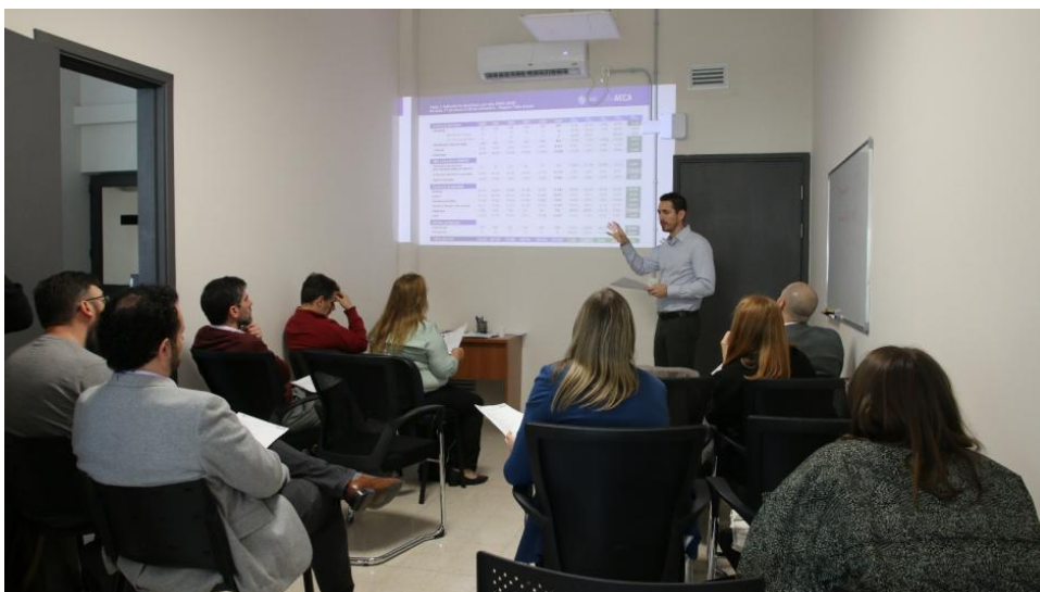
Imagen sobre la presentación de AECA