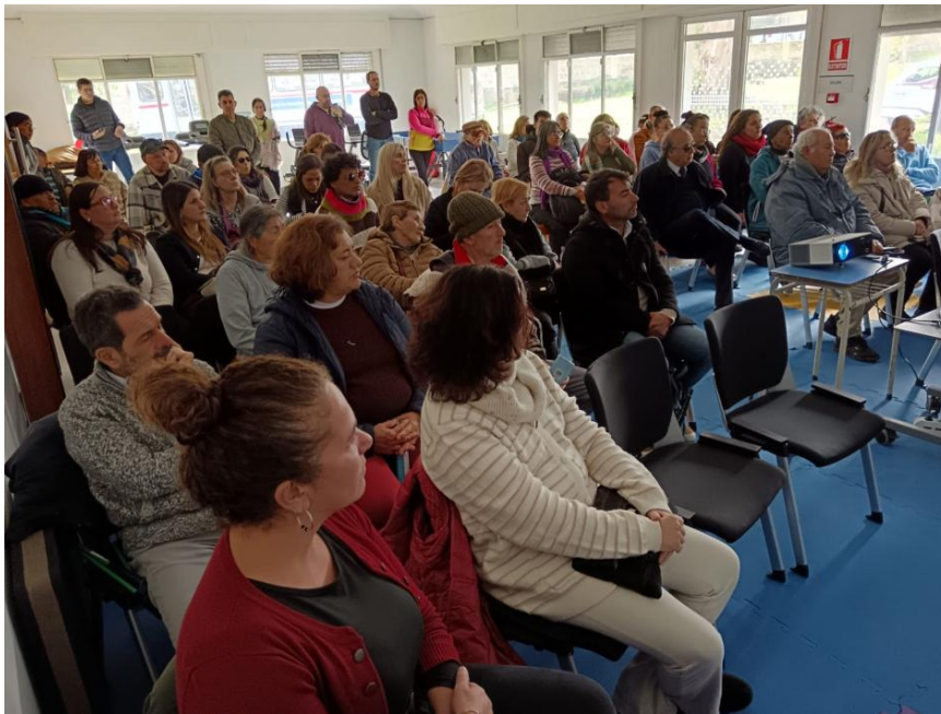
Imagen de una instancia del proceso participativo para la elaboración del Plan Nacional por la Accesibilidad y los Derechos de las Personas con Discapacidad