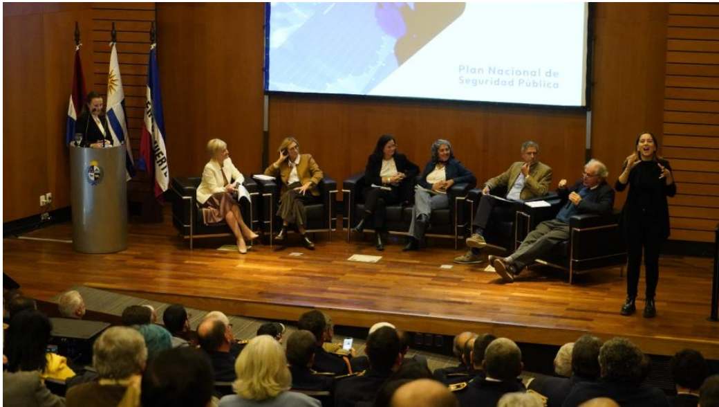
Imagen del Lanzamiento de los Encuentros por Seguridad

complementará con una instancia de validación social orientada a recoger consensos y fortalecer la legitimidad del Plan.