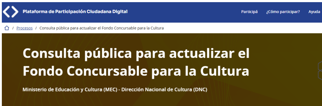
Imagen de la consulta pública para actualizar el Fondo Concursable para la Cultura

Se realizó una consulta pública para la actualización del Fondo Concursable para la Cultura (edición 2026), a través de la Plataforma de Participación Ciudadana Digital y se iniciaron instancias participativas en el marco del desarrollo de una nueva fase de “ Mestiza ”, orientada a la creación de una infraestructura digital pública, abierta e interoperable para la gestión y publicación de colecciones museológicas en Uruguay.