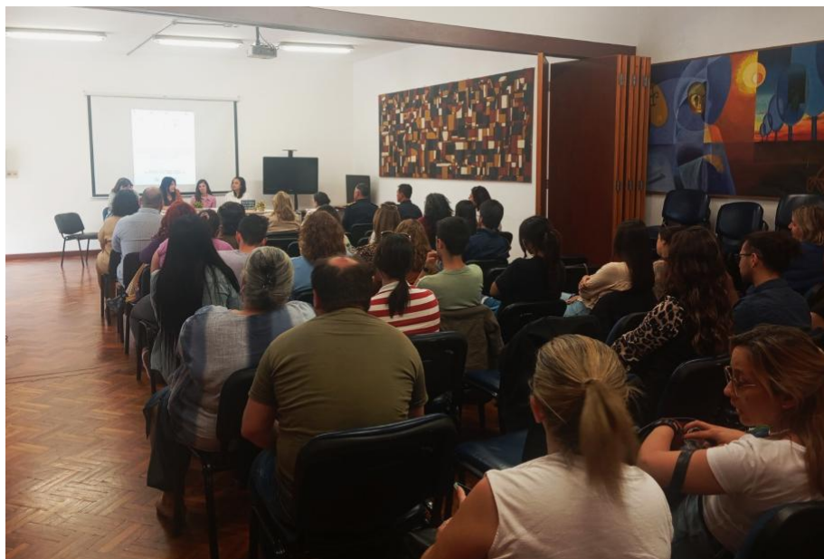
Imagen de la primera Mesa de Diálogo sobre Educación en Derechos Humanos