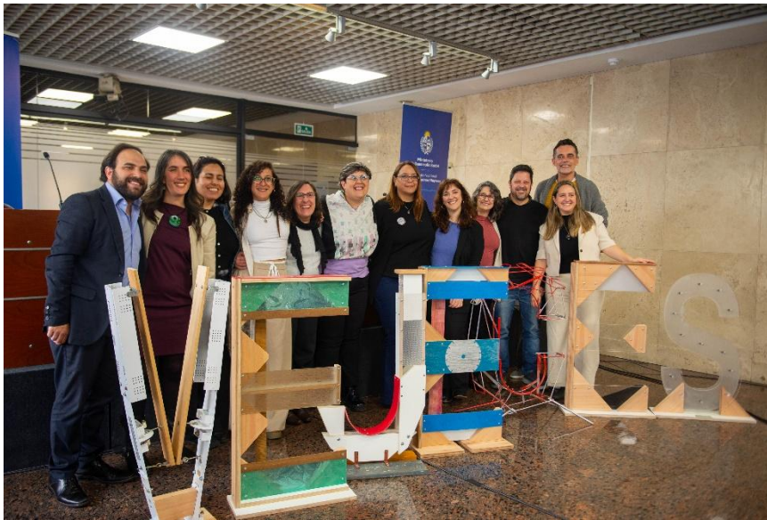
Imagen del lanzamiento del proceso de elaboración del Tercer Plan Nacional de Envejecimiento y Vejez