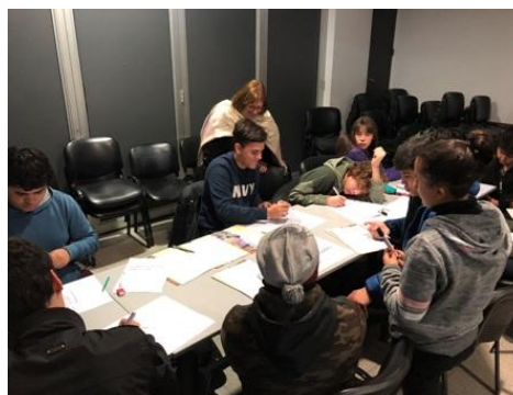
Instituto Superior Brazo Oriental

Como complemento de las actividades anteriores, se está redactando una guía didáctica para docentes y estudiantes, la que será revisada en conjunto con la Red de Gobierno Abierto.