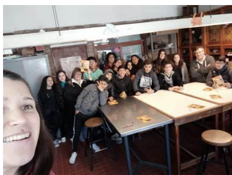
Liceo N° 53 de Montevideo, Candéau de Paso Carrasco

Se seleccionaron centros educativos pilotos y el 28 de marzo de 2019, en el Salón de Actos de Consejo Directivo Central de la ANEP, se realizó el lanzamiento de la propuesta piloto del proyecto , en la cual participaron los equipos de Dirección, adscriptos y otros profesionales de apoyo de los liceos N° 53 de Montevideo, Candéau de Paso Carrasco, Escuela Técnica de Paso Carrasco e Instituto Superior Brazo Oriental, así como representantes de los subsistemas (CES, CETP-UTU), de AGESIC y de la Dirección Sectorial de Información para la Gestión y la Información (CODICEN-ANEP). Las instituciones realizaron aportes a la propuesta educativa. Actualmente se está implementando el piloto de la actividad que permitirá evaluar y generar un modelo a ser aplicado en otros centros educativos.