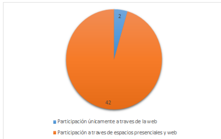
Gráfico 2: Mecanismo de participación utilizado por los actores en el proceso de construcción del Plan.

Es importante aclarar que un mismo actor pudo haber participado a través de los dos mecanismos de forma simultánea: virtual y presencial. En este sentido, y según los datos relevados en la encuesta, solo 2 participantes de los que respondieron la encuesta, utilizaron únicamente la herramienta web como mecanismo de participación. Los restantes 42 personas participaron a través de los espacios presenciales y a través de la web.