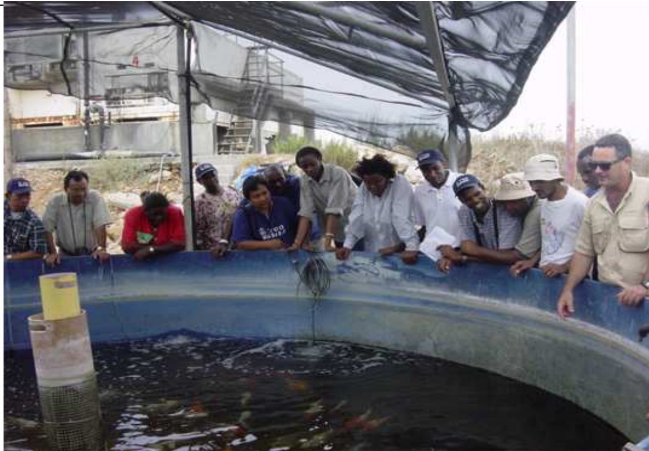
Participants in the International Integrated Regional Development Planning Course on a professional visit to a fish farm in Israel