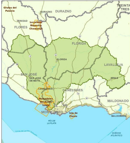
Zonas Meta del Proyecto GEF 7 - Cuenca del Santa Lucia