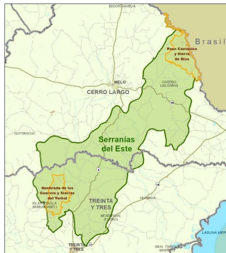
Zonas Meta del Proyecto GEF 7 - Serranías