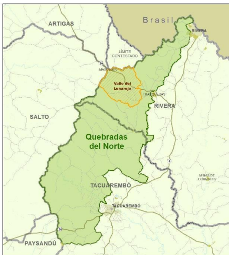
Zonas Meta del Proyecto GEF 7 - Quebradas del Norte