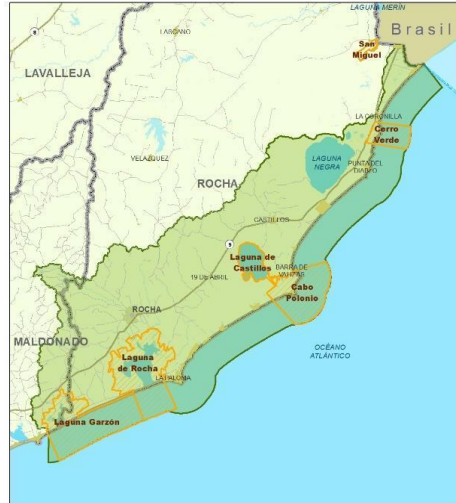
Zonas Meta del Proyecto GEF 7 - Costera Este