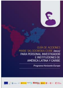
Guía de acciones Marie Skłodowska Curie (MSCA)