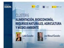
Clúster 6 - Alimentación, Bioeconomía, Recursos Naturales y Medio Ambiente