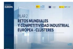
Clúster 2: Cultura, Creatividad y Sociedad Inclusiva