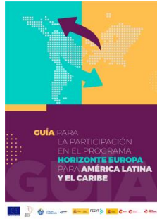
Guía para la participación en el programa Horizonte Europa para ALC