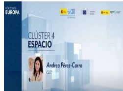
Clúster 4 Digital, Industria y Espacio