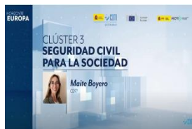
Clúster 3 - Seguridad Civil Para La Sociedad