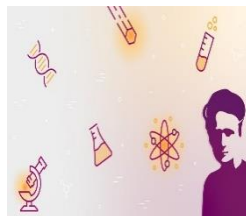
Acciones Marie Skłodowska-Curie (MSCA) en Horizonte Europa. Programa para movilidad en investigación

Los invitamos a suscribirse al nuevo canal de YouTube de la Red LAC NCP. Link: https://www.youtube.com/@redlacncp