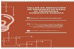
Talleres de redacción de Propuestas para el Programa Horizonte Europa