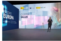
Clúster 1 - Salud