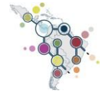
Diagrama 2 Categorías de iniciativas calificables para la convocatoria