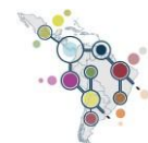
Diagrama 1: Ámbitos en los que se desarrollan actividades de bioeconomía