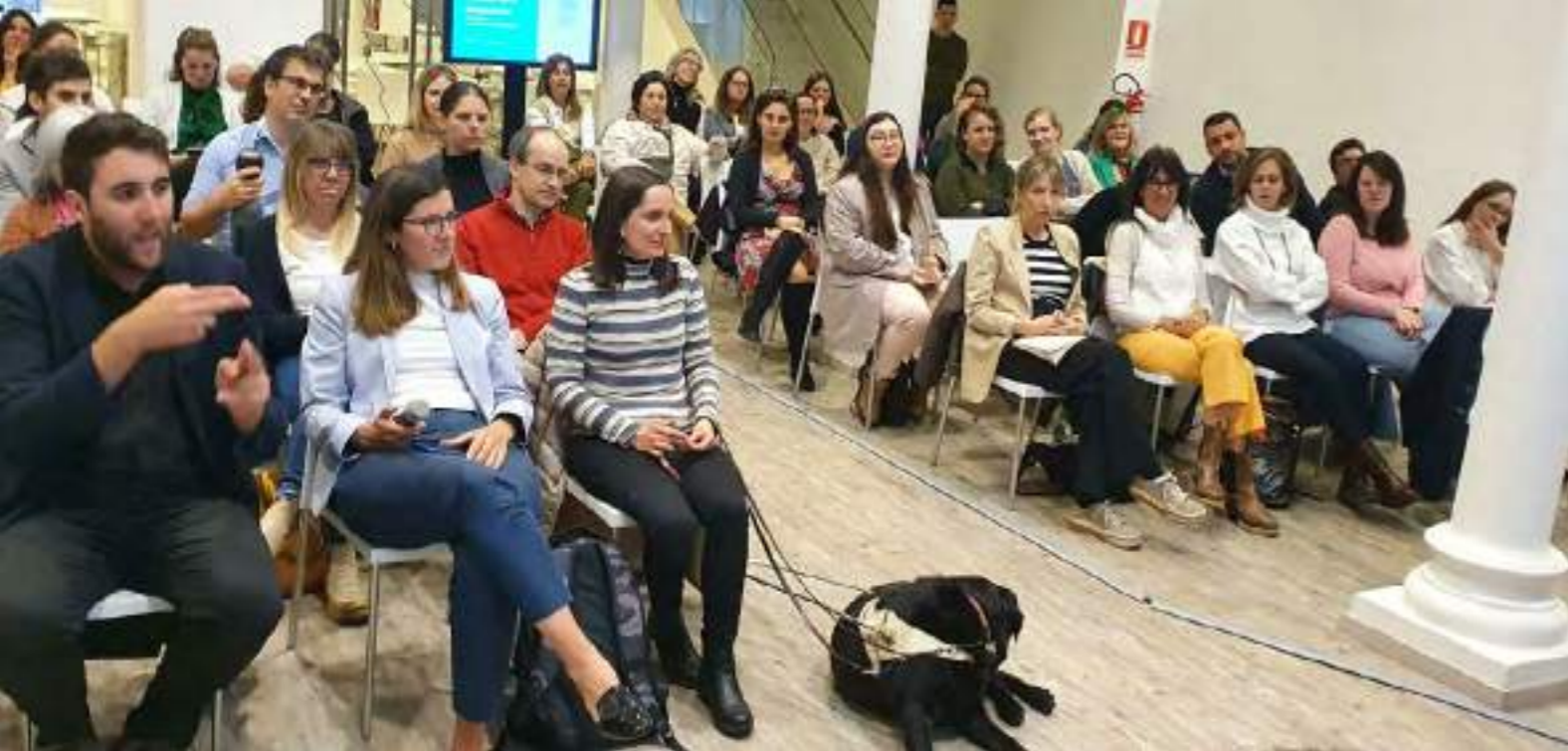
Imagen: Auditorio completo del curso sobre la inclusión de las personas con discapacidad del Sistema de las Naciones Unidas en Uruguay

Se siguió avanzando en la implementación de la Estrategia para la Inclusión de la Discapacidad (UNDIS). UNFPA y ACNUDH continuaron con el trabajo de apoyo técnico para la elaboración y puesta en marcha de un baremo único sobre discapacidad, junto con BPS, Mides, MSP y organizaciones la sociedad civil. Se espera que, a través de un baremo único, se asegure el acceso de las personas con discapacidad a las prestaciones y, al mismo tiempo, simplifique y facilite los procesos de acreditación.