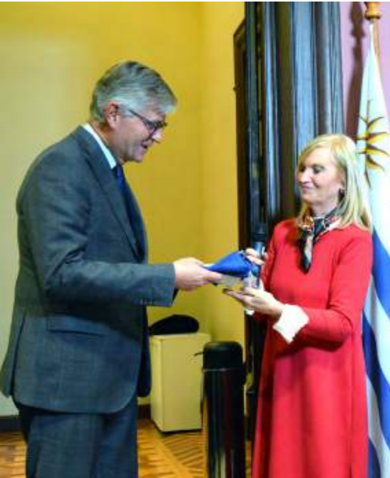
Imagen: El Secretario General Adjunto de Operaciones de Paz de las Naciones Unidas Jean Pierre Lacroix recibiendo el Pabellón Nacional de la Vicepresidenta de la República Beatriz Argimón.

2022 también fue el año de la inauguración de la Casa ONU Uruguay. Como parte de la reforma de la Organización y con el objetivo de mejorar la coherencia, la eficiencia y la eficacia del sistema de las Naciones Unidas, se impulsó activamente el establecimiento de una “Casa ONU” en Montevideo, cuya inauguración se efectivizó en setiembre, con la participación del gobierno, sociedad civil y sector privado.