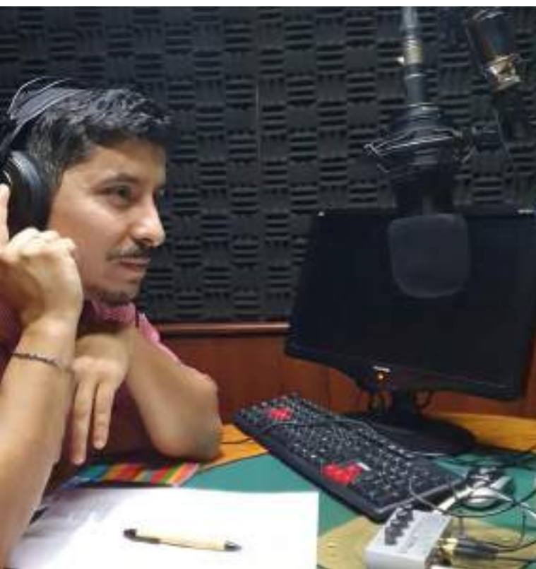
Imagen: Locutor en estudio de radio grabando episodios de "La ONU en Uruguay"

A nivel de comunicación se avanzó en la integración, cohesión y coherencia de un mensaje unificado sobre el trabajo de Naciones Unidas en Uruguay. Entre las más de 20 acciones interagenciales realizadas durante el 2022, entre las que figuran la presencia en eventos de alto nivel con presencia de todo el sistema, destaca la realización de un Podcast titulado: La ONU en Uruguay, Agenda de Desarrollo Sostenible. El mismo consta de 12 capítulos que abordan varios temas que trabajan las Agencias, Fondos y Programas de las Naciones Unidas en Uruguay. El podcast se realizó en alianza con los medios públicos uruguayos. Se emitió una vez por semana en dos radios públicas y posteriormente fueron subidos a la web [ https://mediospublicos.uy/podcast/la-onu-en-uruguay-agenda-de-desarrollo-sostenible/ ]