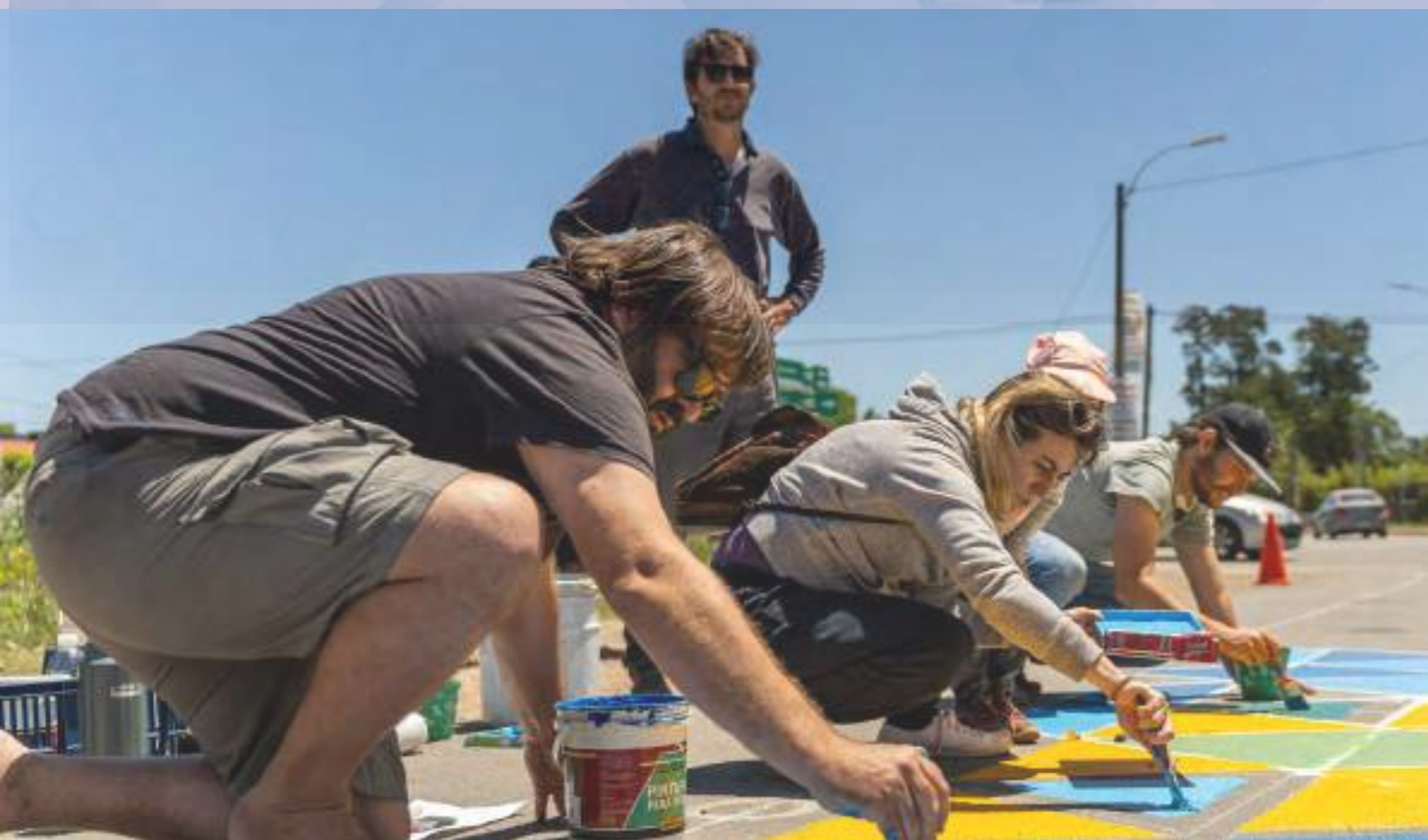
Imagen: Participantes de la iniciativa del PNUD “Tu Calle” en Ciudad de la Costa.

Más información: https://stories.undp.org/humanizar-las-ciudades