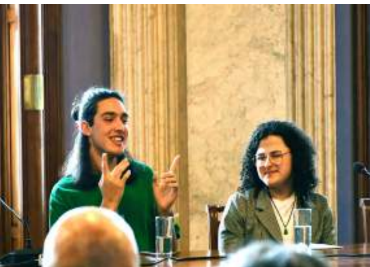
Imagen: Expositores participantes en el primer conversatorio de Futuro sobre Crisis Climática

La iniciativa continuará en 2023 y 2024, recorriendo temas como democracia paritaria, transformación de la educación, protección de la salud mental, producción sostenible, el envejecimiento de la población y su relación con la reingeniería de las instituciones y políticas de protección social, entre otros.