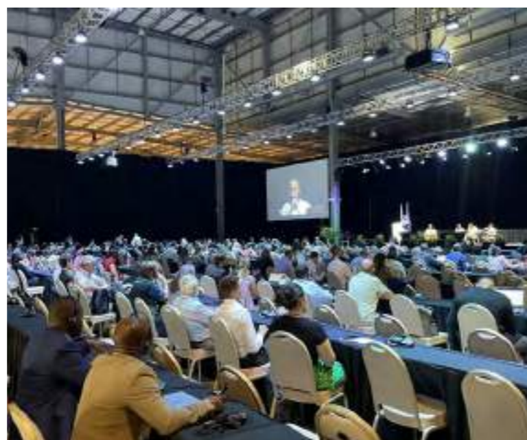
Imagen: Auditorio completo en el Centro de Convenciones de Punta del Este en la Conferencia sobre la Contaminación por Plásticos.