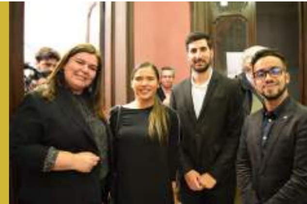
Imagen: Invitados a la inauguración de la Casa ONU Uruguay