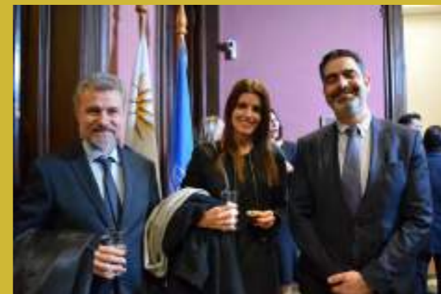
Imagen: Invitados a la inauguración de la Casa ONU Uruguay