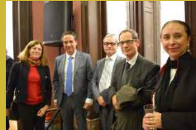
Imagen: Miembros del Equipo de País de las Naciones Unidas en Uruguay en la inauguración de la Casa ONU Uruguay