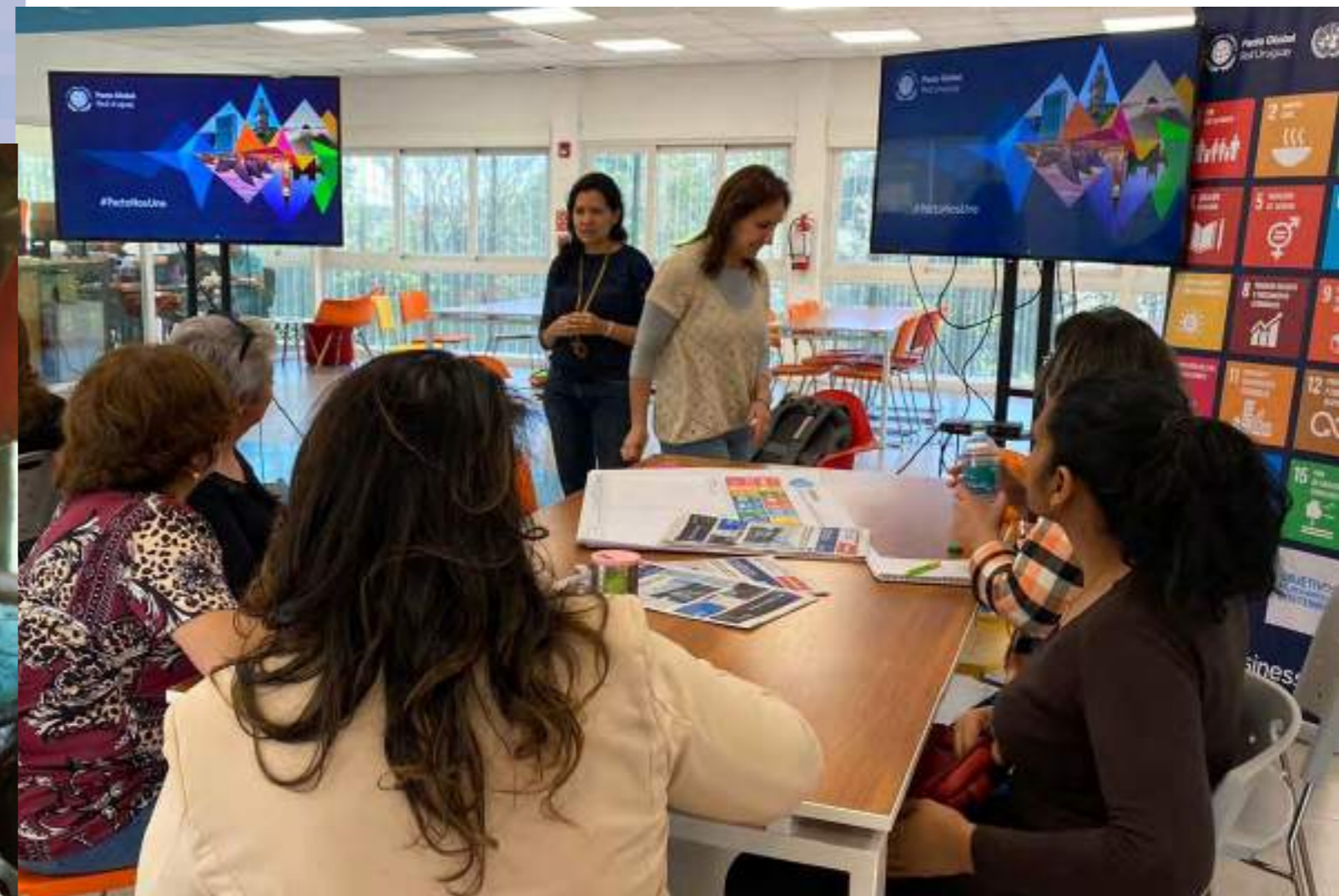
Imagen: Mesa de trabajo de Pacto Global

Asimismo, la red local de Pacto Global de Naciones Unidas se consolidó como actor relevante del ecosistema de sostenibilidad empresarial en Uruguay. El trabajo realizado permitió llegar al término del año a 45 empresas uruguayas adheridas, que reúnen a más de veinte mil trabajadores en diversos sectores (servicios, forestal, salud, tecnología, financiero, transporte e industria). Se trabajó con 18 empresas participantes en dos programas de inmersión de alto impacto: el acelerador de género “WEPs Academy” –implementado en cooperación con ONU Mujeres– y el acelerador Ambición por los Objetivos de Desarrollo Sostenible.