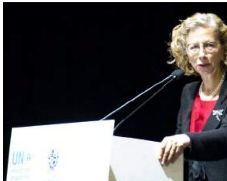
Imagen: Directora Ejecutiva del Programa de las Naciones Unidas para el Medio Ambiente, Inger Andersen.

“Al 2025 Uruguay habrá promovido una transición hacia sistemas de producción y consumo sostenibles, basados en la innovación, el conocimiento científico y la incorporación de tecnología, fortaleciendo la resiliencia y la equidad.”