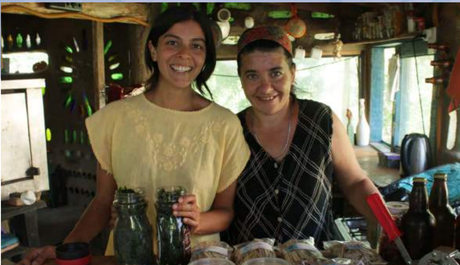
Imagen: Participantes del Programa de apoyo a mujeres migrantes emprendedoras

Link al video: https://www.youtube.com/watch?v=kW0uml0y2KM