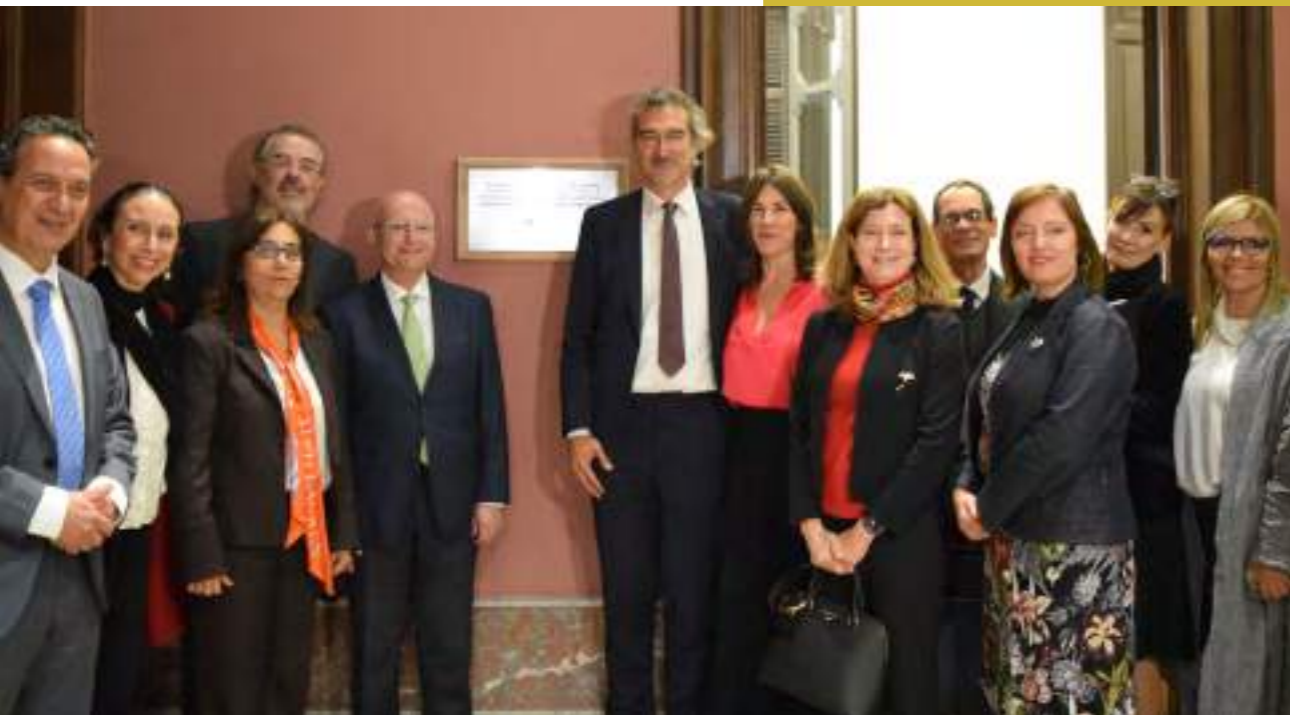
Imagen: Equipo de País de las Naciones Unidas en Uruguay en la inauguración de la Casa ONU Uruguay

2022 también fue el año de la inauguración de la Casa ONU Uruguay. Como parte de la reforma de la Organización y con el objetivo de mejorar la coherencia, la eficiencia y la eficacia del sistema de las Naciones Unidas, se impulsó activamente el establecimiento de una “Casa ONU” en Montevideo, cuya inauguración se efectivizó en setiembre, con la participación del gobierno, sociedad civil y sector privado.