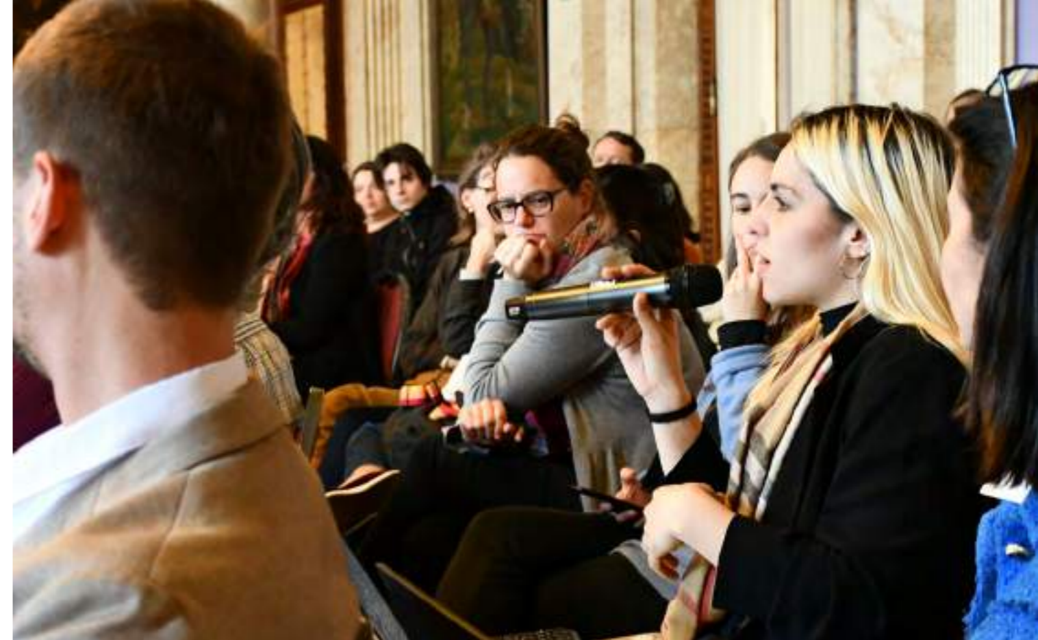
Imagen: Público participante en el primer conversatorio de Futuro sobre Crisis Climática

Esta iniciativa fue lanzada en agosto del 2022 con el objetivo de crear un espacio plural, convocando a diversos actores (del gobierno, la sociedad civil, el sector privado y la academia), para reflexionar, dialogar e identificar posibles puntos de acuerdo en torno a los principales