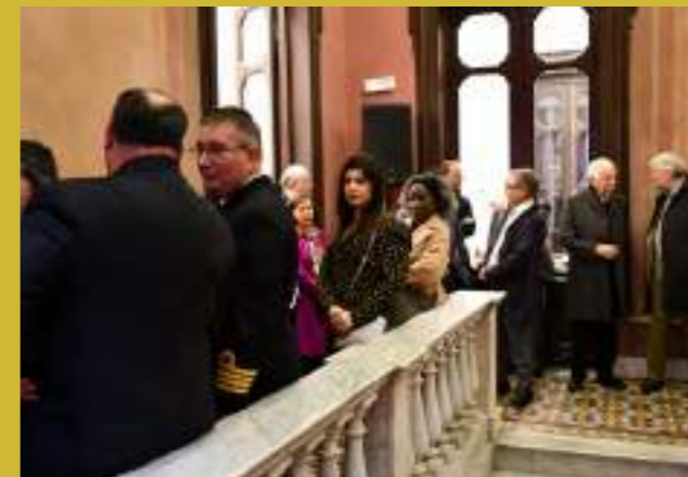
Imagen panorámica con invitados a la inauguración de la Casa ONU Uruguay