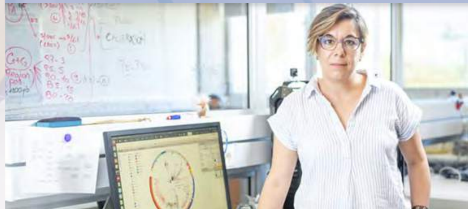
Imagen: Dra. Mir, ganadora del premio impulsado por L'Oréal y UNESCO con el apoyo del Ministerio de Educación y Cultura de Uruguay.

Para más información: https://forocilac.org/mujeres-en-la-ciencia/