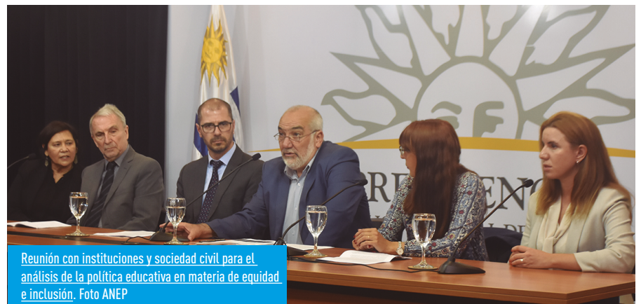
Reunión con instituciones y sociedad civil para el análisis de la política educativa en materia de equidad e inclusión.