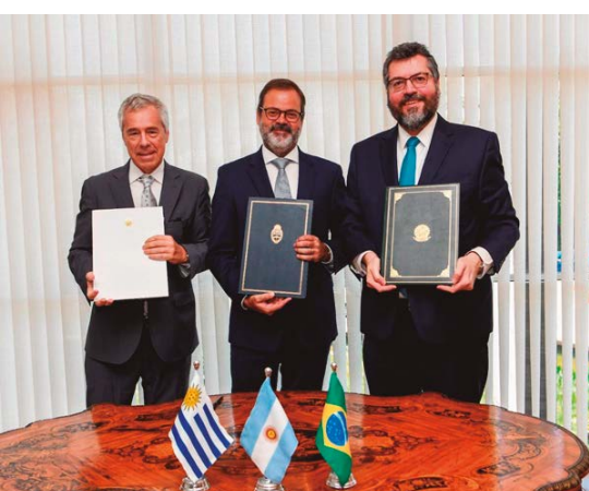
Firma del memorándum de entendimiento del Comité de Integración Trinacional.

Las ciudades de Barra do Quaraí (Brasil), Bella Unión (Uruguay) y Monte Caseros (Argentina), en la triple frontera entre los tres países, cuentan con el primer Comité de Integración Trinacional gracias al apoyo de EUROSOCIAL+. La firma en Brasilia de un memorándum de entendimiento entre los tres países dio vida al Comité del que forman parte estas tres ciudades separadas entre sí por ríos y que sueñan desde hace décadas con más puentes que las conecten y que les permitan conformar un polo de desarrollo regional.