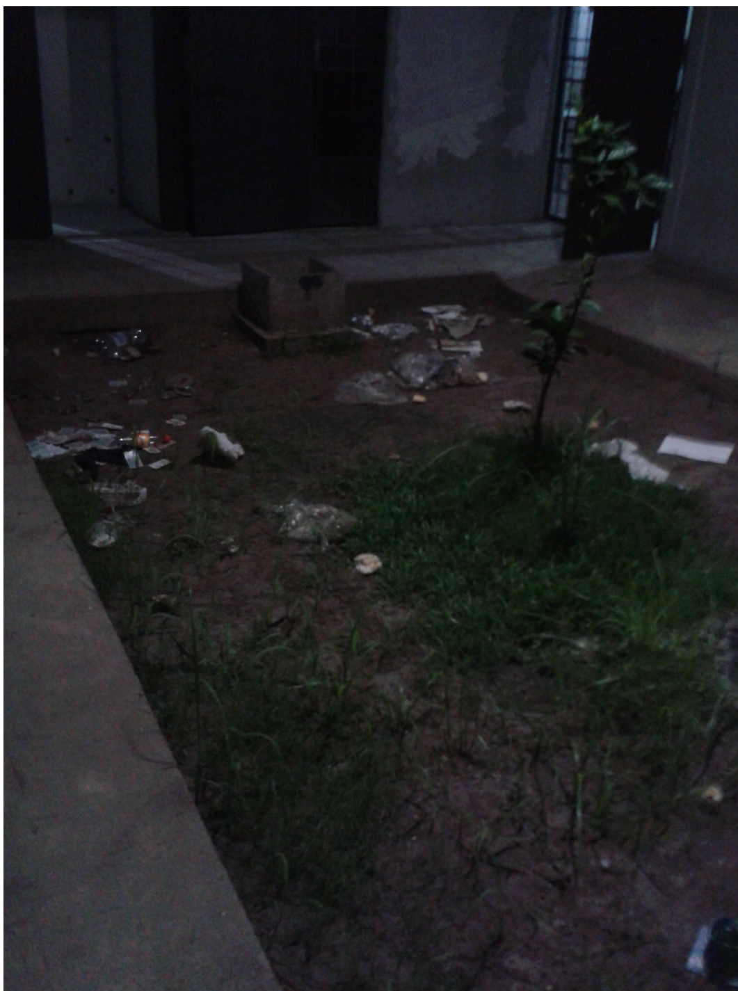
FOTO 2: Estado de uno de los patios de la construcción inaugurada en abril que se encuentra en refacción.