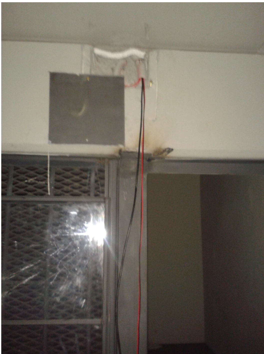
FOTO 4: Refacciones realizadas en el centro inaugurado en abril dentro de uno de los sectores.