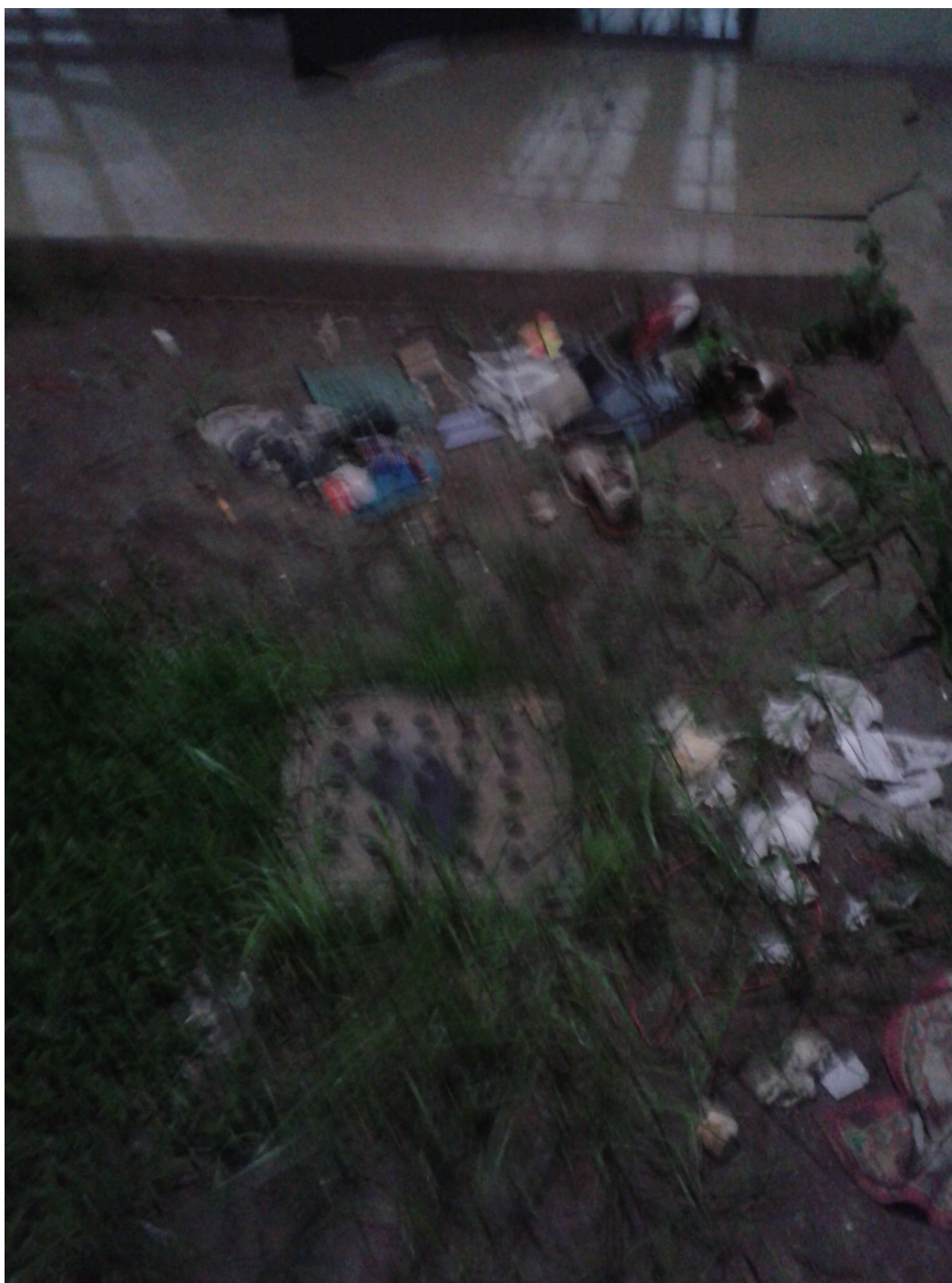
FOTO 3: Otra vista de uno de los patios de la construcción inaugurada en abril que se encuentra en refacción.