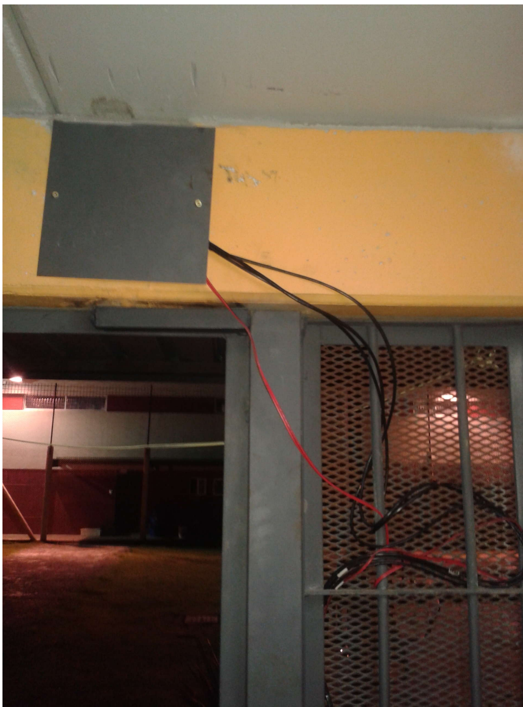
FOTO 5: Refacciones realizadas en el centro inaugurado en abril en el área exterior a los celdarios.