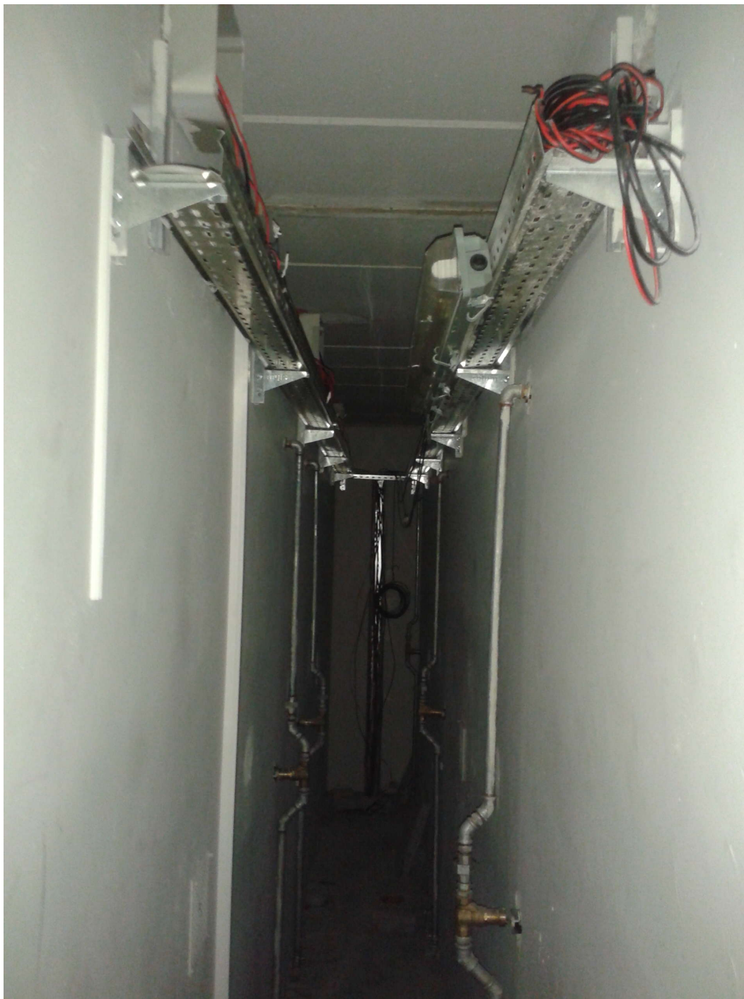
FOTO 6: Refacciones realizadas en el centro inaugurado en abril en el espacio ciego de distribución entre los celdarios.