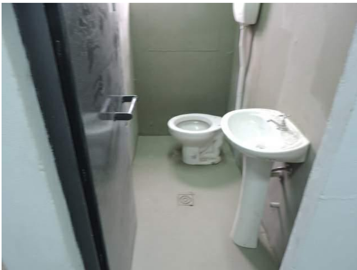
Foto 28: Instalaciones sanitarias del área educativa no habilitada.