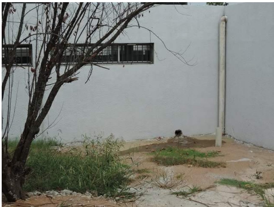
Foto 34: Agujero abierto en pared del gimnasio para permitir la evacuación de agua.