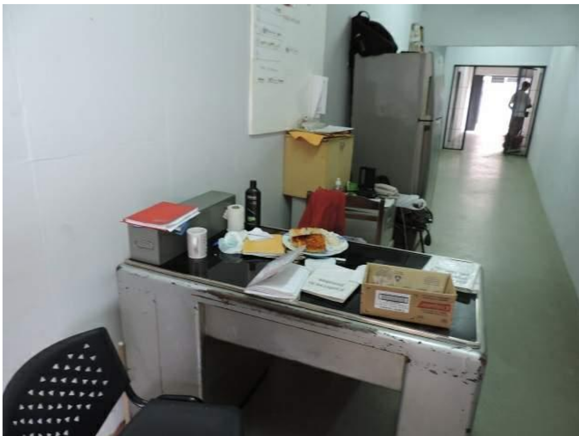
Foto 21: Área de educadores y coordinación instalada en un corredor.