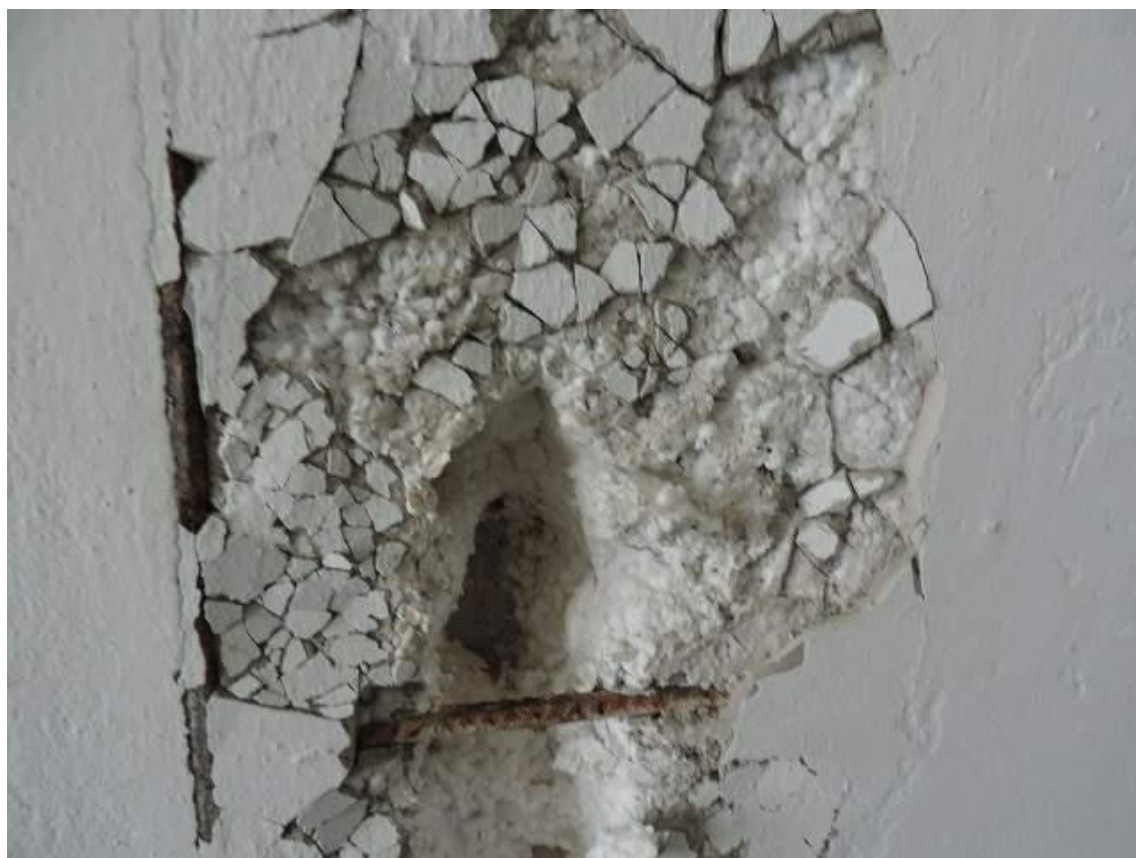
Foto 8: Detalle de revoques desprendidos en celdas con estructura de hierro visible.