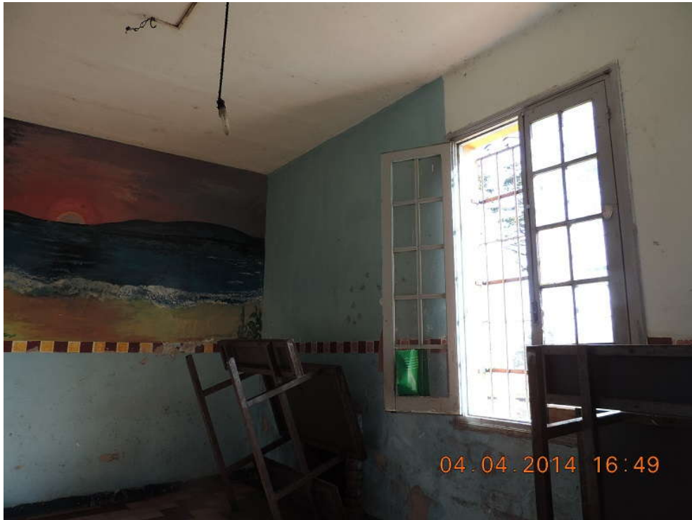
Foto: 13 comedor