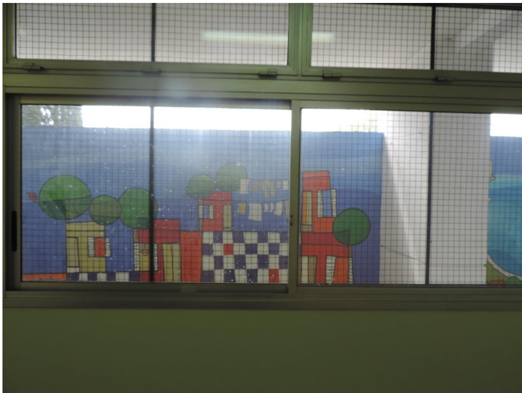
Foto 4– Vista exterior de ingreso a Unidad 9, ventanas de piso 1 y 2 Oeste