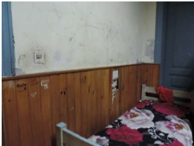
Foto N° 12: Paredes y lambriz deteriorado en dormitorio de jóvenes