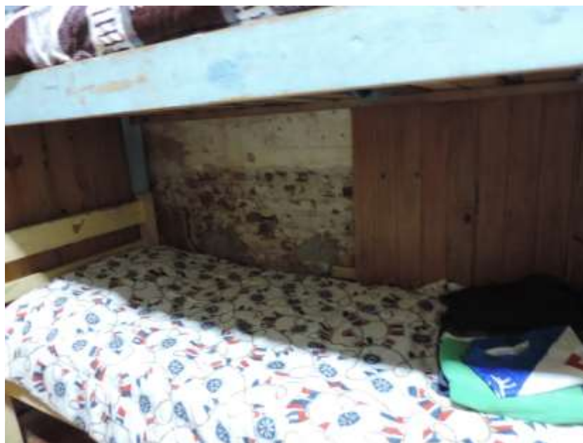
Foto N° 14: pared sin lambriz y con deterioro en dormitorio de jóvenes