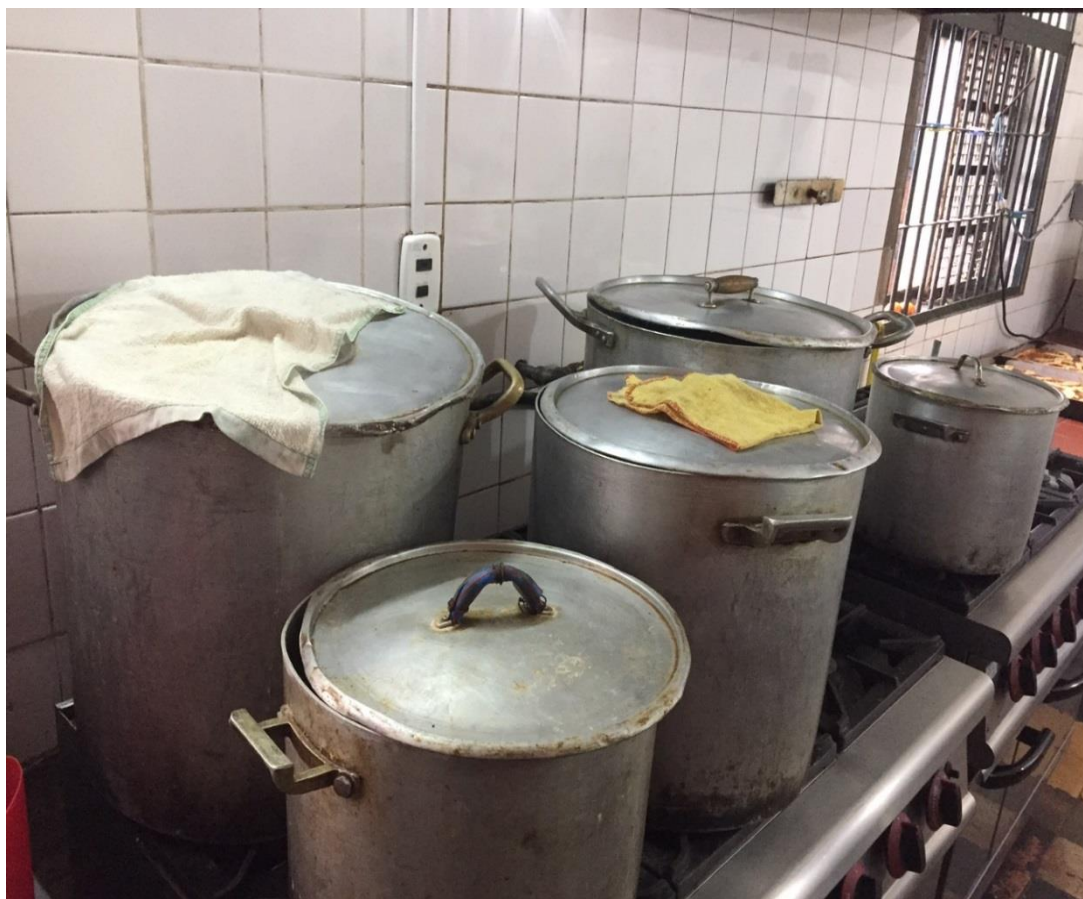
Foto N° 1: Ollas de agua caliente para que los adolescentes puedan bañarse.