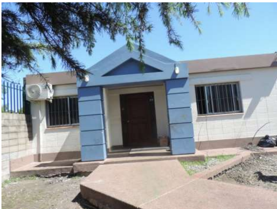
Foto 1: Ingreso al centro, con piedras en sector lateral (Octubre de 2017)