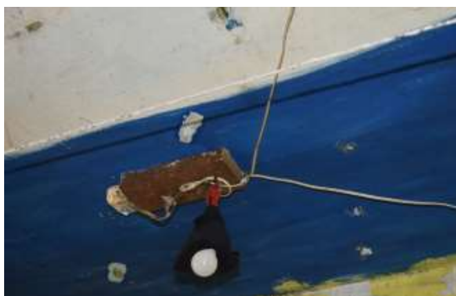
6 de diciembre de 2023.