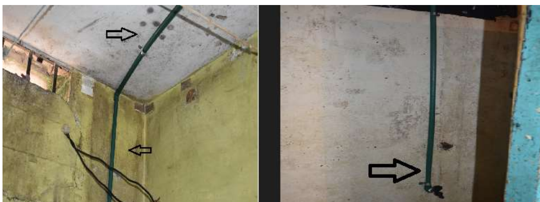
6 de diciembre de 2023.

Sin embargo, no se han subsanado las condiciones inadecuadas de la instalación sanitaria compuesta en cada celda por una pileta de hormigón y una taza en la cual se vuelca el agua con baldes o bidones utilizando la canilla existente en el baño. La Regla 15 de las Reglas Mínimas de las Naciones Unidas para el Tratamiento de los Reclusos (Reglas Mandela) determinan que “las instalaciones de saneamiento serán adecuadas para que el recluso pueda satisfacer sus necesidades naturales en el momento oportuno y en forma aseada y decente”. 8