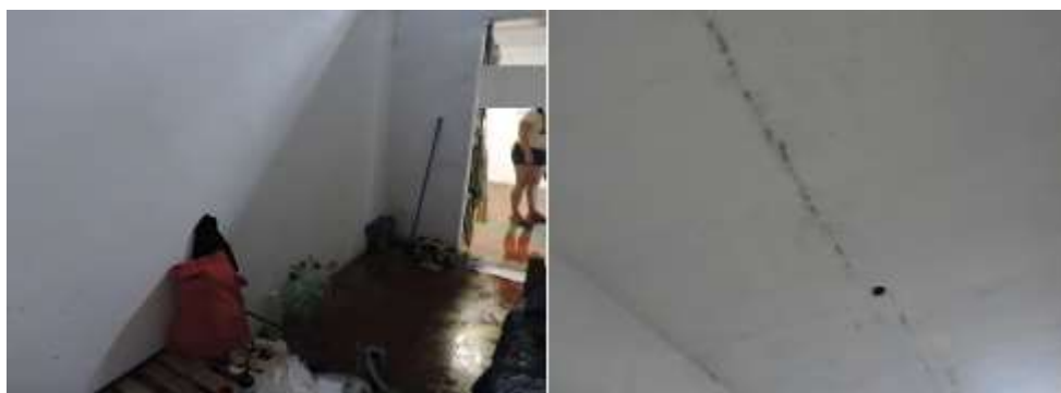
6 de diciembre de 2023.