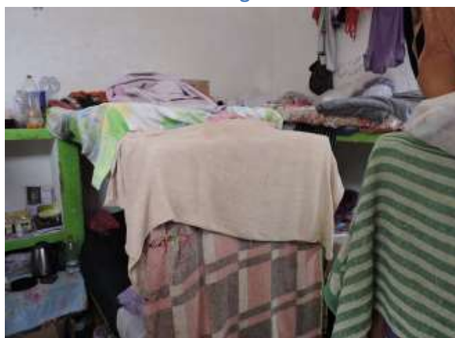
6 de diciembre de 2023.