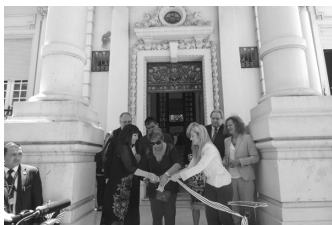
Inauguración sede INDDHH, 2016