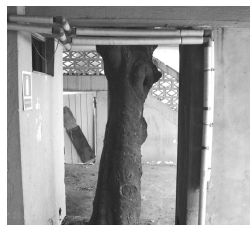
Estado del inmueble ex sede del SID y posteriormente CALEN en el año 2012