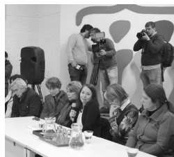
Inauguración Sitio de Memoria, 2018

que asumió los aspectos técnico-profesionales del proyecto.