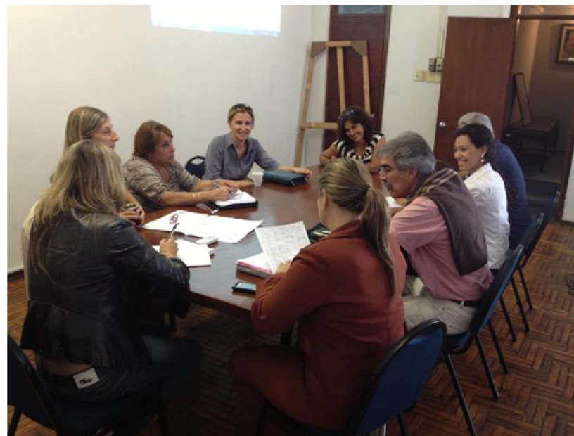
Proyecto conjunto con Bagé