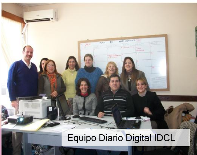
Equipo Diario Digital IDCL

Capacitación: Funcionarios de Oficinas de Transparencia sobre la contraloría social y el monitoreo ciudadano en el logro de una gestión pública transparente y participativa.