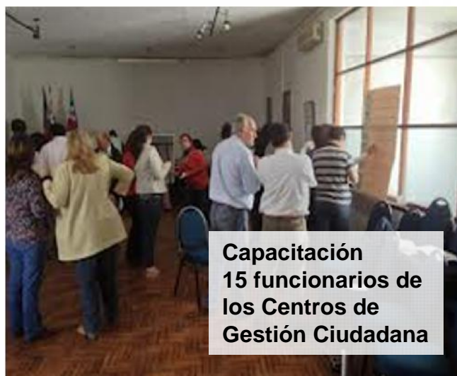
Capacitación 15 funcionarios de los Centros de Gestión Ciudadana