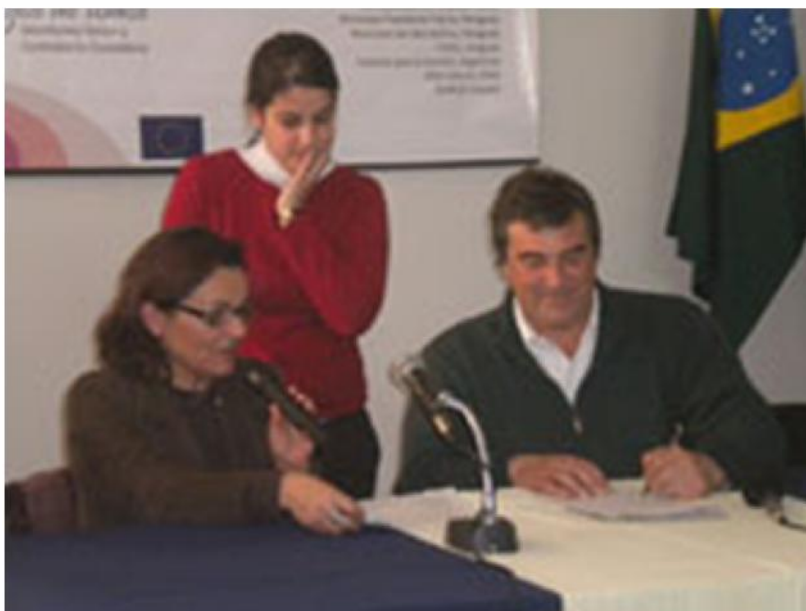
Convenio con Alegrete

Prefeitura de Alegrete: Intercambio de Experiencias