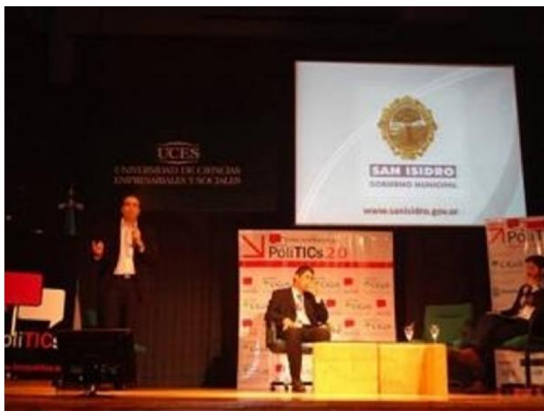
Intendente Gustavo Posse San Isidro, Argentina