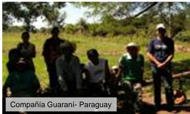
Compañía Guaraní- Paraguay