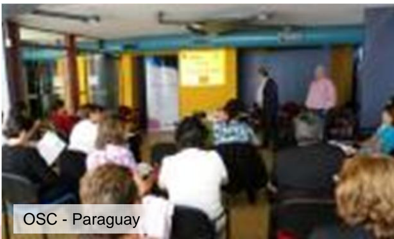
OSC - Paraguay