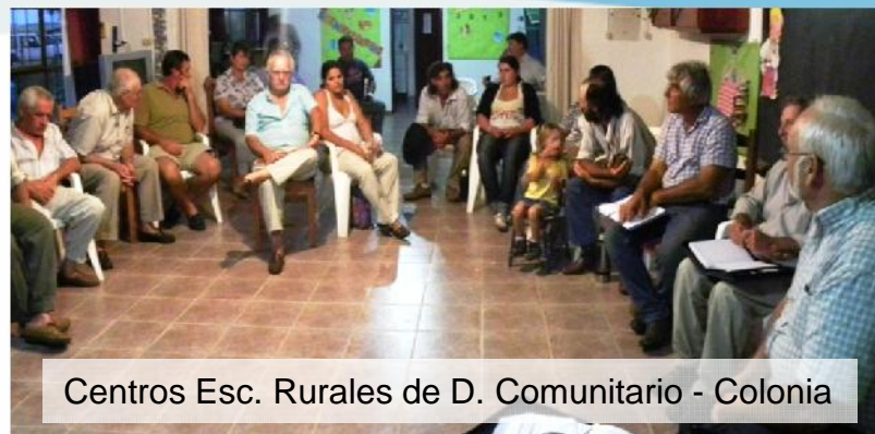
Centros Esc. Rurales de D. Comunitario - Colonia