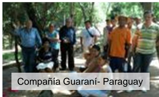
Compañía Guaraní- Paraguay