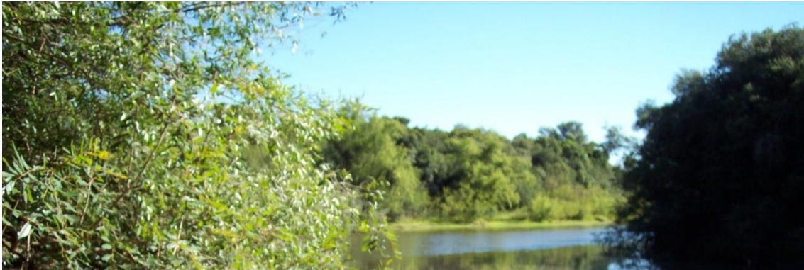
Tabla de contenido

Proyecto: Fortalecimiento de la Comisión de Cuenca del Río Negro