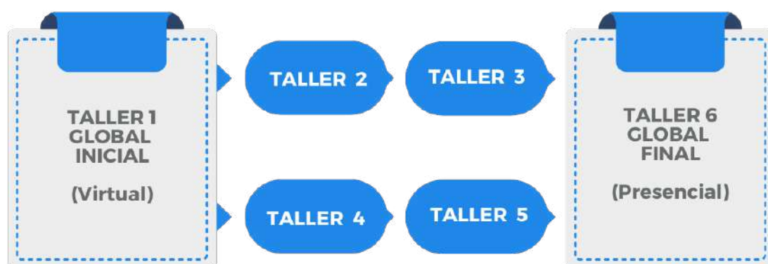
Esquema de la etapa de proceso participativo ENACE Uruguay

Ello implicó el diseño de instancias virtuales y presenciales, con una concurrencia promedio de 60 personas. Los insumos resultantes fueron considerados en la elaboración del documento ENACE.