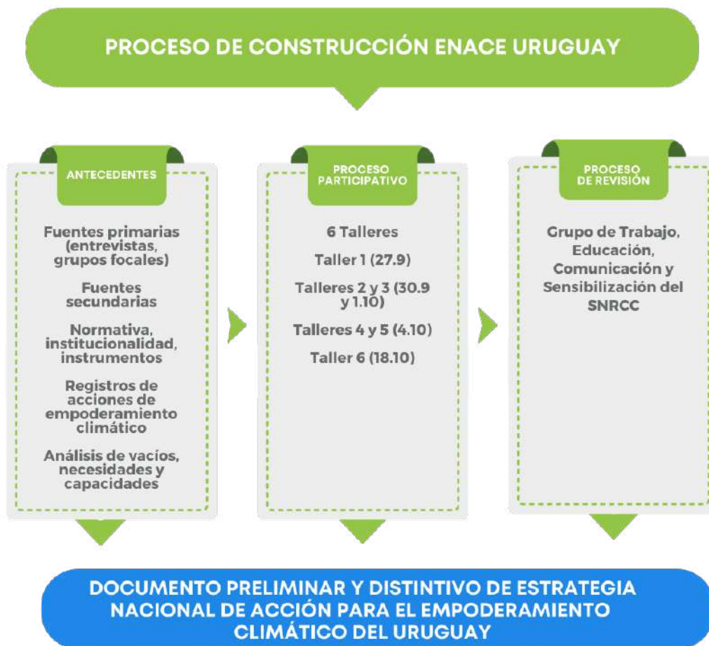
Proceso de construcción de ENACE Uruguay