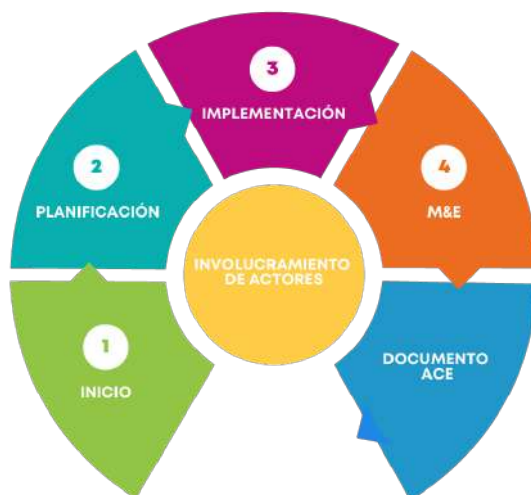
Figura 1. Principales fases para la implementación de una estrategia ACE

La metodología planteada en el documento guía para el diseño de una estrategia ACE 4 , se basa en cuatro fases: inicio, planificación, implementación, monitoreo y evaluación, tomando como núcleo de las mismas el involucramiento de los diferentes actores.