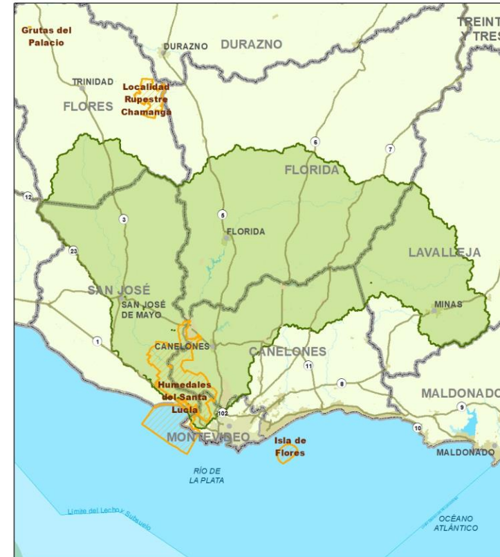
Zonas Meta del Proyecto GEF 7 - Cuenca del Santa Lucía