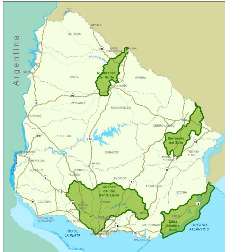
Zonas Meta del Proyecto GEF 7