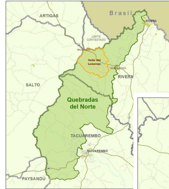
Zonas Meta del Proyecto GEF 7 - Quebradas del Norte