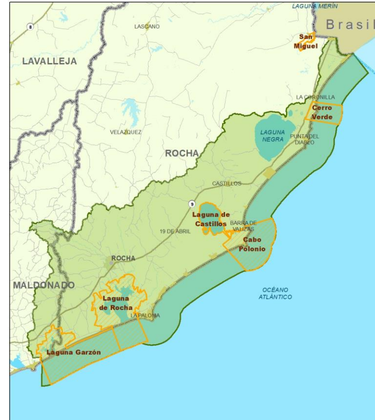
Zonas Meta del Proyecto GEF 7 - Costera Este