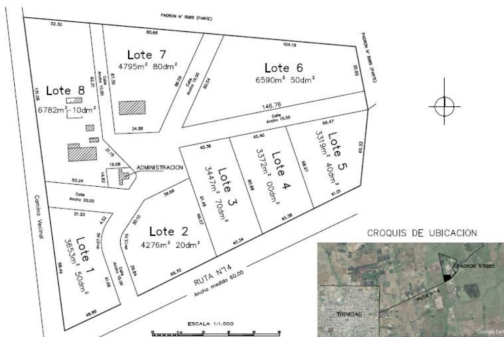
Ilustración 1. Plano de distribución de Lotes en el EcoParque Industrial Trinidad (EPI)

Ya se está trabajando en lograr acuerdos con otras empresas que agregarían alternativas de valorización de otro tipo de residuos y emprendimientos de economía circular.