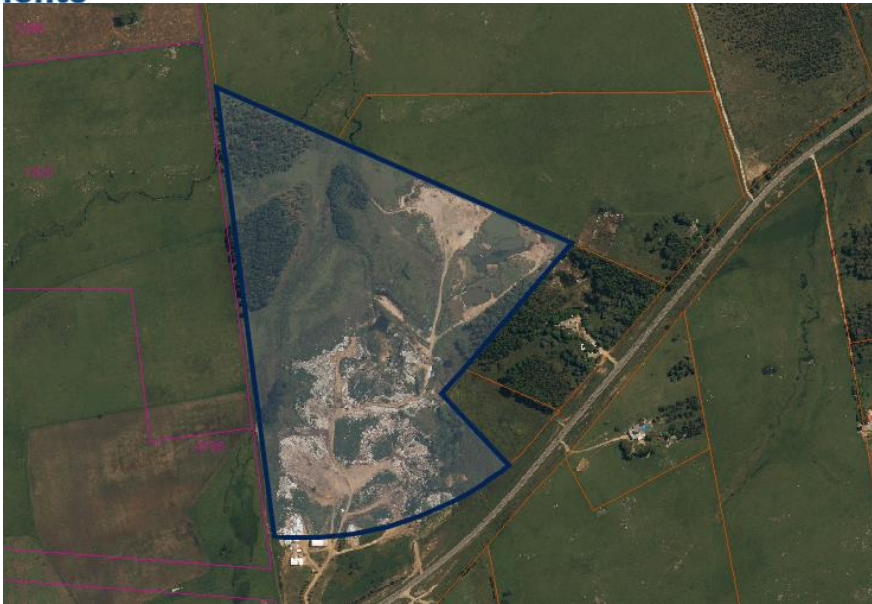
Ilustración 4: Padrón 8985, localización del actual vertedero de Trinidad (GeoCatastro)