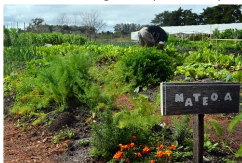
Ilustración 2. Huerta comunitaria

Las podas recibidas en las volquetas, al igual que el aspirado de hojas son chipeados y junto a los residuos orgánicos provenientes del hipodromo son compostados en un predio perteneciente a la intendencia donde también opera una huerta comunitaria. Este material está a disposición de los usuarios de la huerta. Es de señalar que la huerta comunitaria es un programa de la intendencia con enfoque socioproductivo en la cual se le da un espacio productivo a las personas de la comunidad con especial énfasis a los sectores más vulnerables (adultos mayores, víctimas de violencia de género y niños dependientes de Inau).