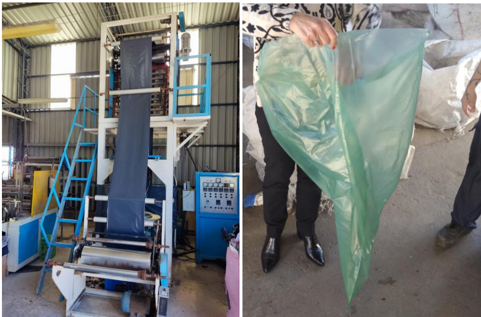
Ilustración 3. Producción de bolsas en el EPI y Bolsa verde producida en el EPI que llega a COREFLO.

La bolsa verde es elaborada en el EPI con material reciclado la cual vuelve a las casas de los vecinos para depositar los elementos reciclables, los cuales son recolectados por COREFLO cerrando el ciclo.