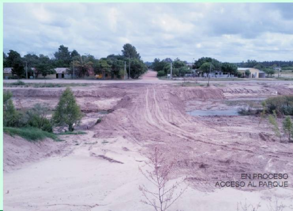
EN PROCESO ACCESO AL PARQUE