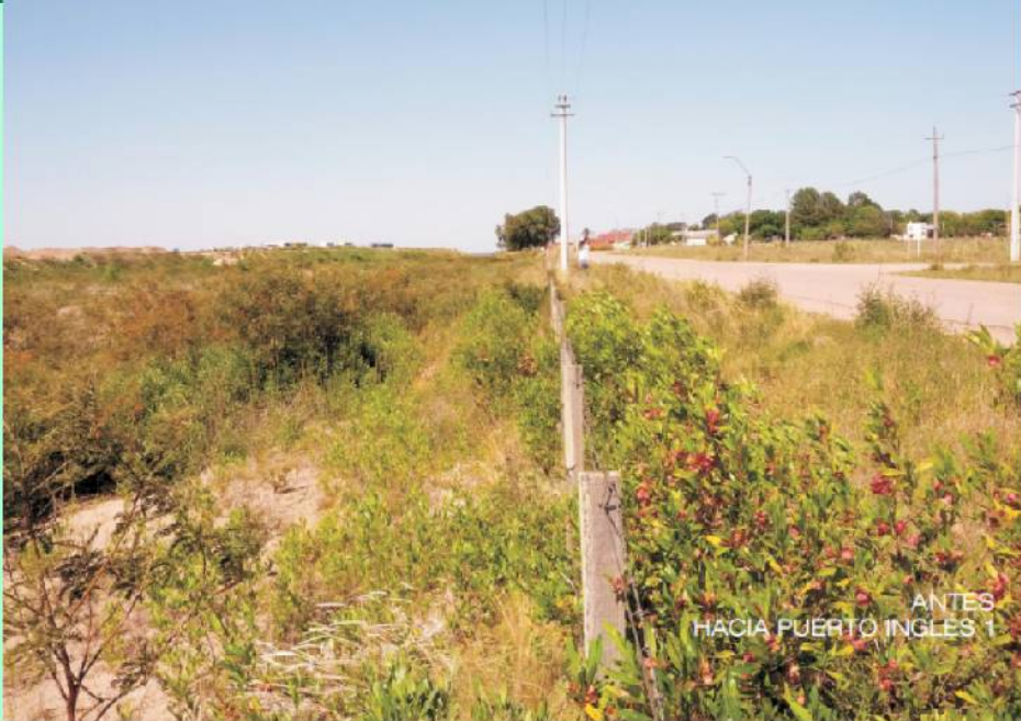
ANTES HACIA PUERTO INGLÉS 1