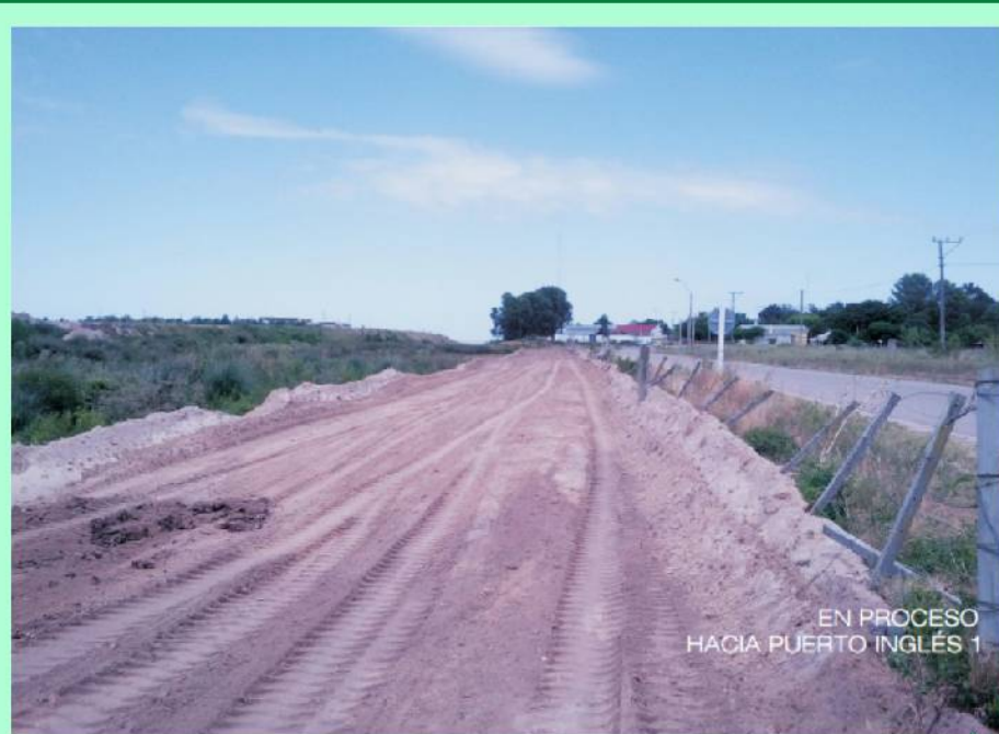
EN PROCESO HACIA PUERTO INGLÉS 1