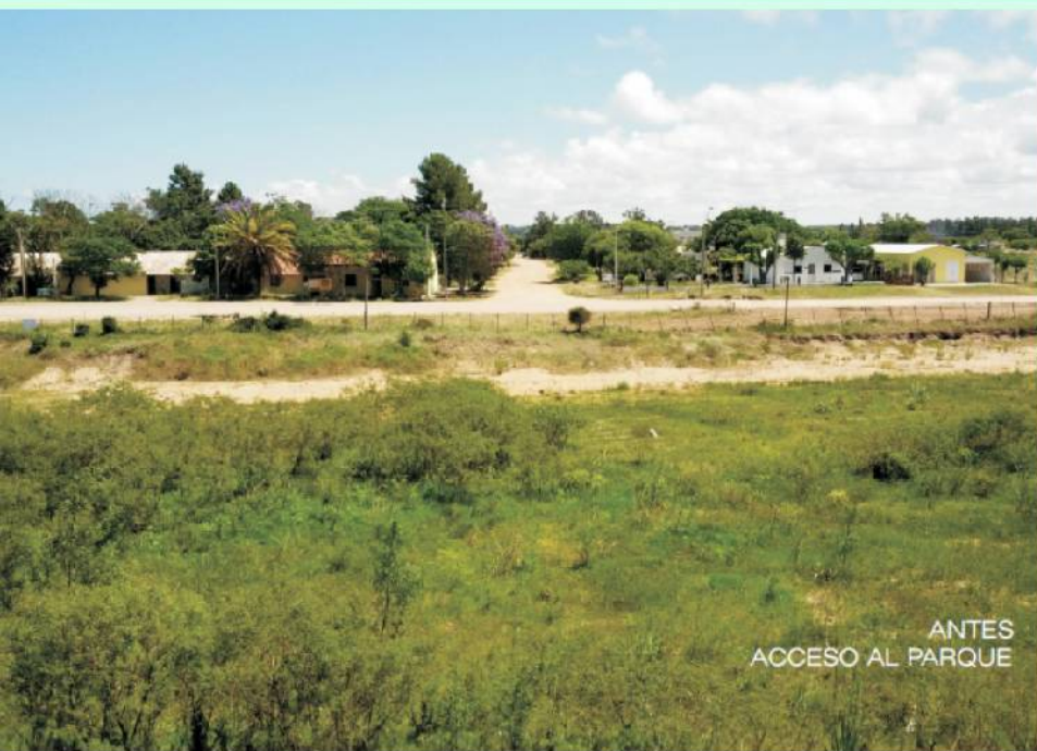
ANTES ACCESO AL PARQUE