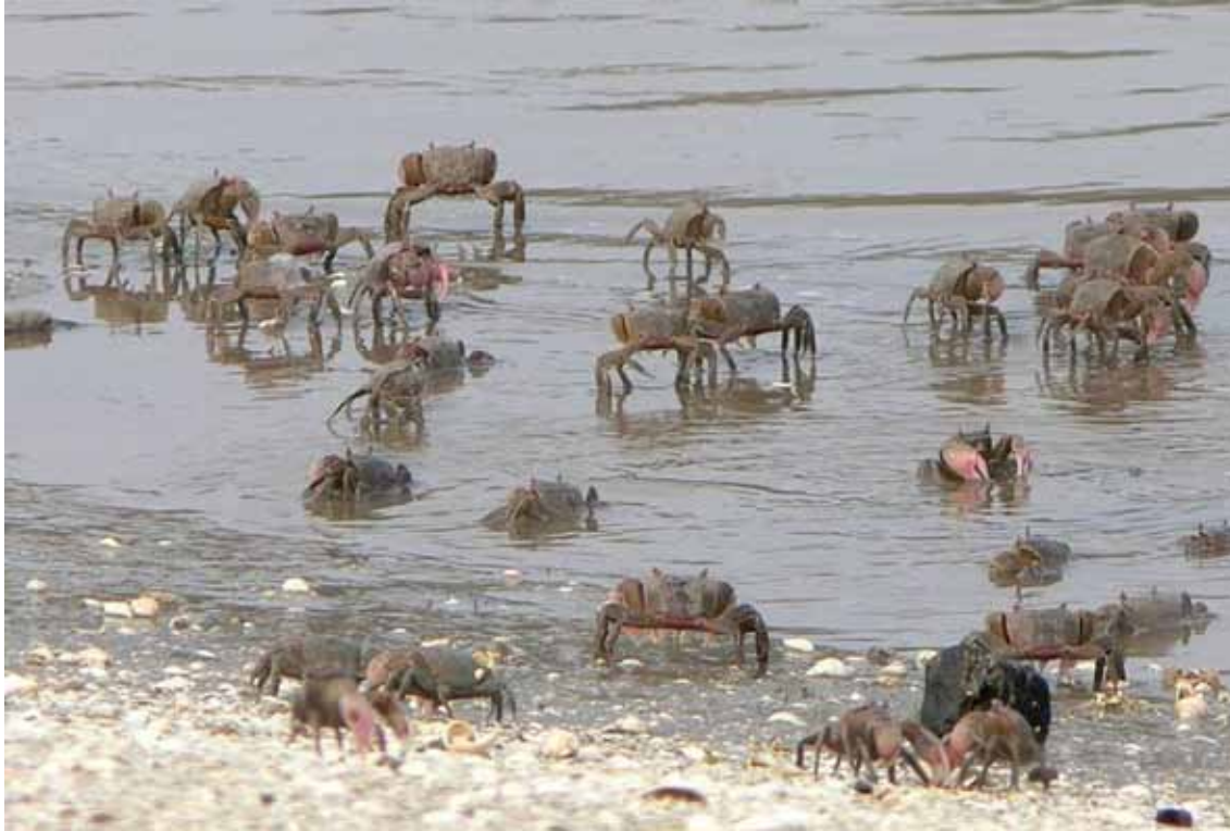
Cangrejos ( Neohelice granulata ) en los ambientes salobres de los estuarios de los arroyos y lagunas costeras.