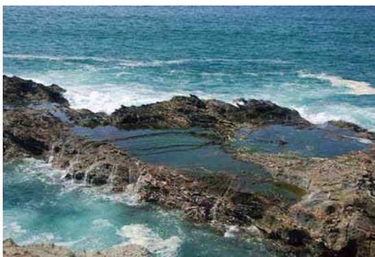
Pileta intermareal. Pozos donde el agua del océano permanece cuando baja la marea.

La costa de los Departamentos de Maldonado y Rocha son ambientes netamente oceánicos. En la zona intermareal de las playas abundan los crustáceos conocidos como tatucitos y pulgas de mar, así como las almejas, berberechos y caracoles. En las rocas mientras tanto, el ambiente es mucho más diverso y contiene gran cantidad de poliquetos y anélidos, cangrejos, camarones, algas, esponjas, mejillones, caracoles, balanos y anémonas. Las piletas intermareales son ambientes particularmente interesantes para observar todos estos organismos en su ambiente natural.