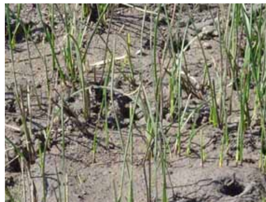
Cuevas de los cangrejales ( Neohelice granulata ).