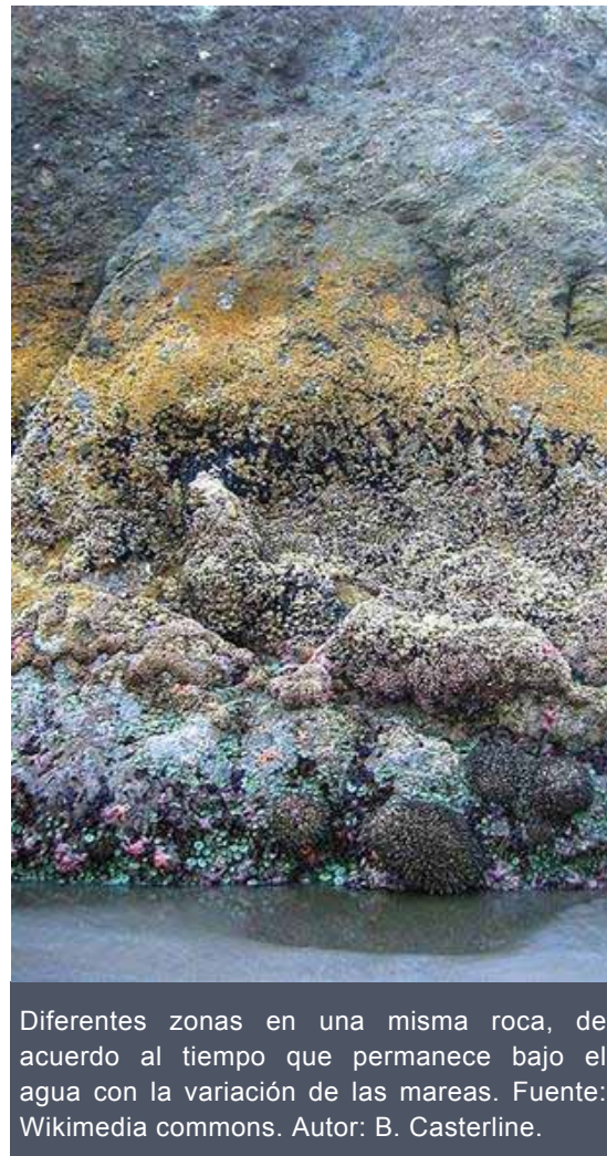
Diferentes zonas en una misma roca, de acuerdo al tiempo que permanece bajo el agua con la variación de las mareas.

Otros animales que allí habitan se pueden desplazar. Estos son los cangrejos, poliquetos y los piojos de las rocas. Los primeros y los últimos son crustáceos. A los cangrejos ya los conocemos mientras que los piojos de las rocas son más parecidos a los "bichos de humedad", pero se mueven muy rápido entre las rocas y hasta los podríamos confundir con cucarachas. Tanto los cangrejos como los piojos de mar se alimentan de restos. Los poliquetos son unos animales parecidos a los ciempiés, y viven bajo el agua.