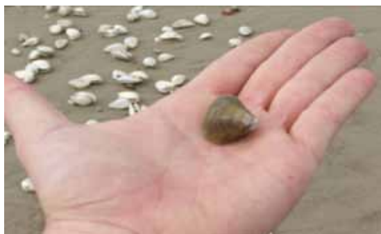
Ejemplar de Corbícula , especie de almeja exótica, en una playa de San José.