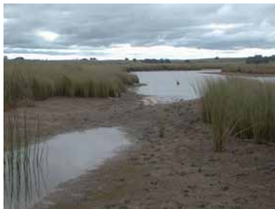
Marisma. Ambiente de cangrejales en la desembocadura del arroyo Solís Grande.

Los pequeños estuarios (zona ensanchada de las desembocaduras) de los arroyos de todos los Departamentos son ambientes de deposición, es decir, donde el agua se remansa y decantan (van cayendo al fondo) partículas que están suspendidas. Por eso son lugares fangosos. En estos ambientes, dulces o salobres, están habitados por enormes poblaciones de cangrejos denominados cangrejo cavador o de estuario ( Neohelice granulata ), por eso a estas zonas se las llama popularmente "cangrejales".