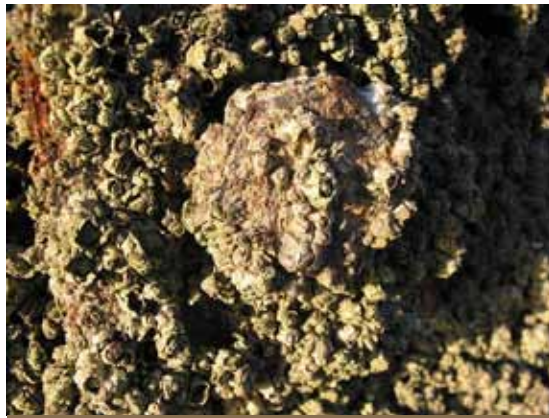
Balanos en una roca.