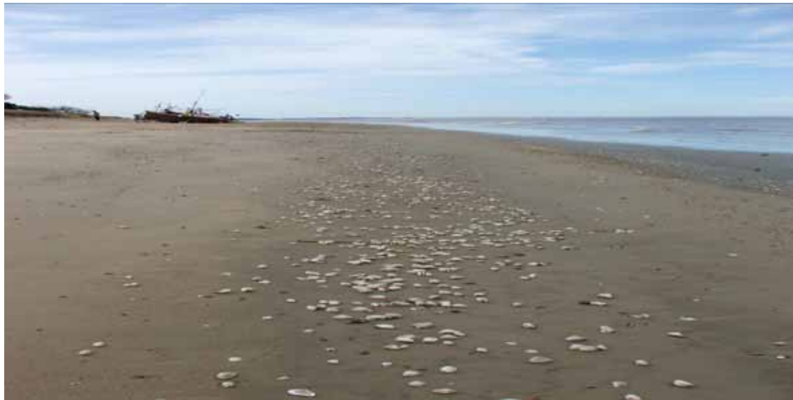
Bivalvos arrojados por la marea en una playa de San José.

Recientemente los investigadores han descubierto especies de moluscos exóticos, es decir que provienen de ecosistemas lejanos a nuestras costas, que paulatinamente han ido colonizando ambientes arenosos de esta zona, como la almeja asiática ( Corbícula spp) y ambientes rocosos, como el mejillón cebra ( Limnoperna fortunei ), también de origen asiático. Estas especies han desembarcado con el agua de lastre que traen los barcos mercantes y rápidamente han comenzado a reproducirse y ocupar ambientes que antes sólo estaban ocupados por especies autóctonas, es decir de esta zona. El asentamiento de las especies invasoras está provocando así una disminución de las especies de moluscos autóctonos.