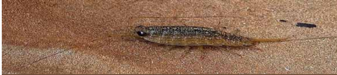
Ejemplar de piojo de las rocas ( Lygia exotica )