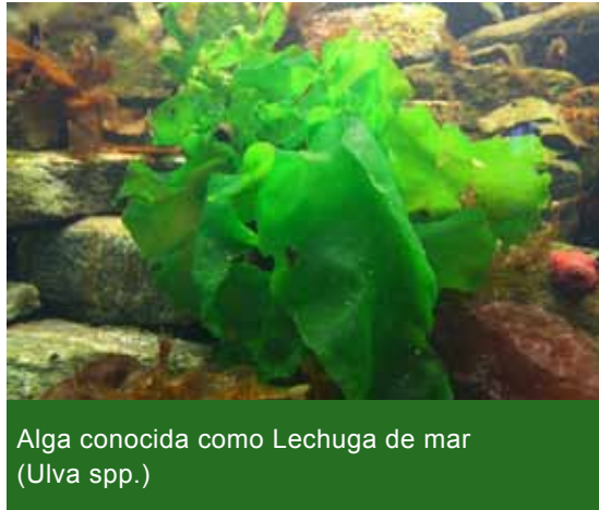
Alga conocida como Lechuga de mar (Ulva spp.)

Lentamente, a medida que vamos viajando hacia el este, el agua comienza a ser más salobre y menos turbia. Además, la costa comienza a presentar mayor cantidad de afloramientos rocosos. La fauna bentónica de la costa arenosa del Río de la Plata medio no es demasiado diferente a la del Alto Río de la Plata, pero sí la rocosa. Las costas de Montevideo se caracterizan por presentar playas de escasa longitud, interrumpidas por importantes afloramientos rocosos que dan lugar a restingas y arrecifes cubiertos por unos crustáceos pequeños y sésiles llamados balanos, algas y mejillones.