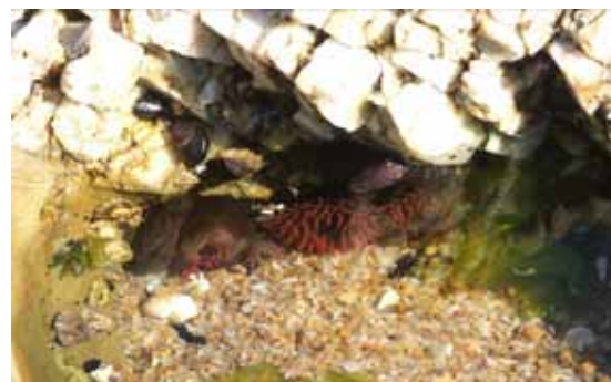
Anémonas, animal que vive adherido a las rocas de la zona intermareal de la costa oceánica. Con sus coloridos tentáculos captura su alimento, que lo lleva hacia el centro, donde tiene la boca.