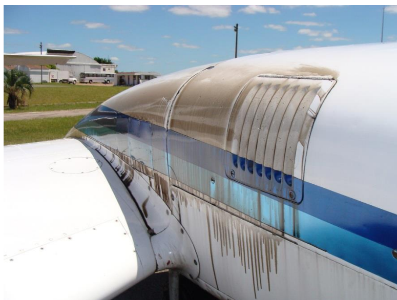
Vista de adelante hacia atrás del motor izquierdo

La aeronave regresó a SULS y aterrizó sin ninguna otra novedad.