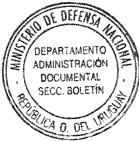
DR. JAVIER GARCÍA MINISTRO DE DEFENSA NACIONAL

5º. Publíquese, por el Departamento Administración Documental remítase copia de la presente Resolución al Tribunal de Cuentas y al Director de Asuntos Jurídicos, Notariales y Derechos Humanos y pase al Comando General de la Fuerza Aérea a sus efectos.