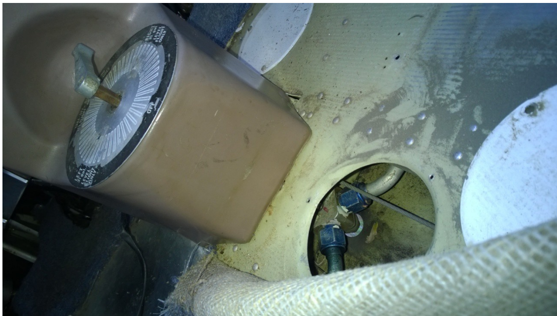
Foto 1. Vista de la selectora de combustible