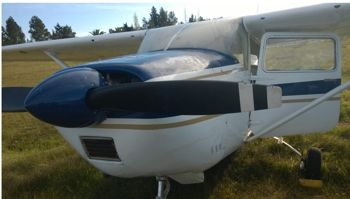
Vista de la aeronave estacionada a un lado de la Ruta 1