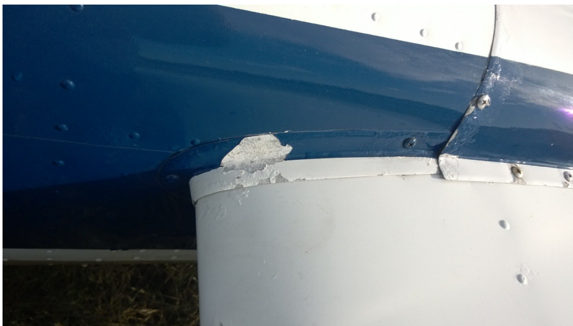
Foto 2. Detalles de mantenimiento.