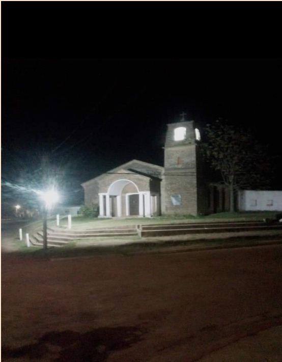
GRUTA LA LLORONA