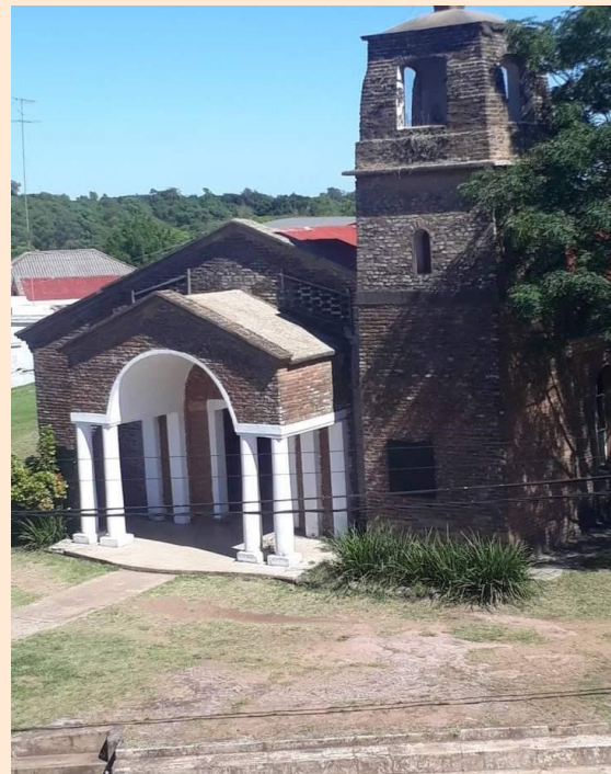
PLAZA DE LA PALOMA