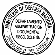
ELEUTERIO FERNANDEZ HUIDOBRO

Publicado en Boletín M.D.N. Nº El Jefe de la Sección Boletín