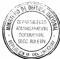
ELEUTERIO FERNANDEZ HUIDOBRO

Publicado en Boletín M.D.N. Nº 12027 El Jefe Interino del D.A.D. Cap. (MDN) ANEXO