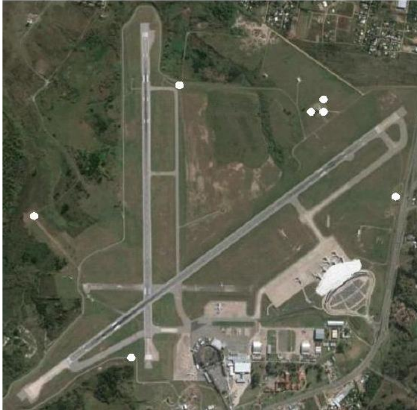
Fig. 4 Posiciones relativas de las cámaras de seguridad