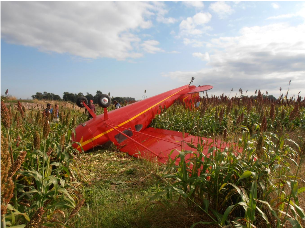
Posición final de la aeronave.

Los daños fueron importantes en la hélice, en la estructura y revestimiento de ambas alas, en las superficies de control de cola, en revestimientos de capots superior e inferior y en su estructura principal (techo).