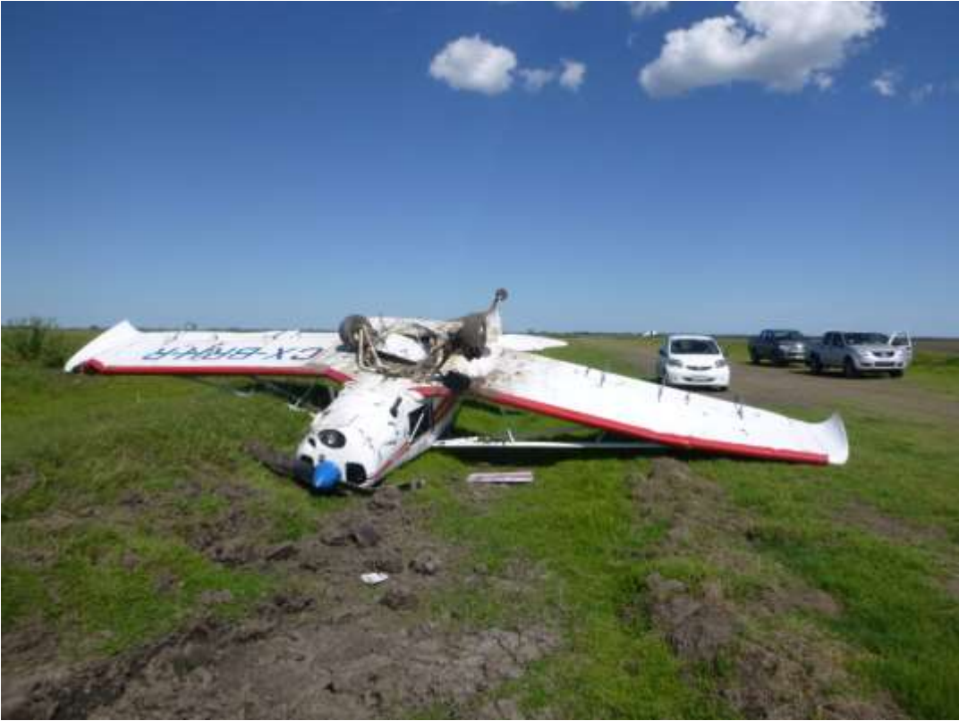
Posición final de la aeronave.