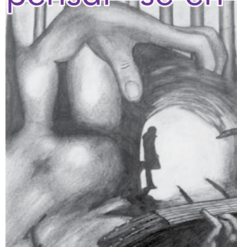
Dibujo realizado por tallerista de "La Piel de los sueños"