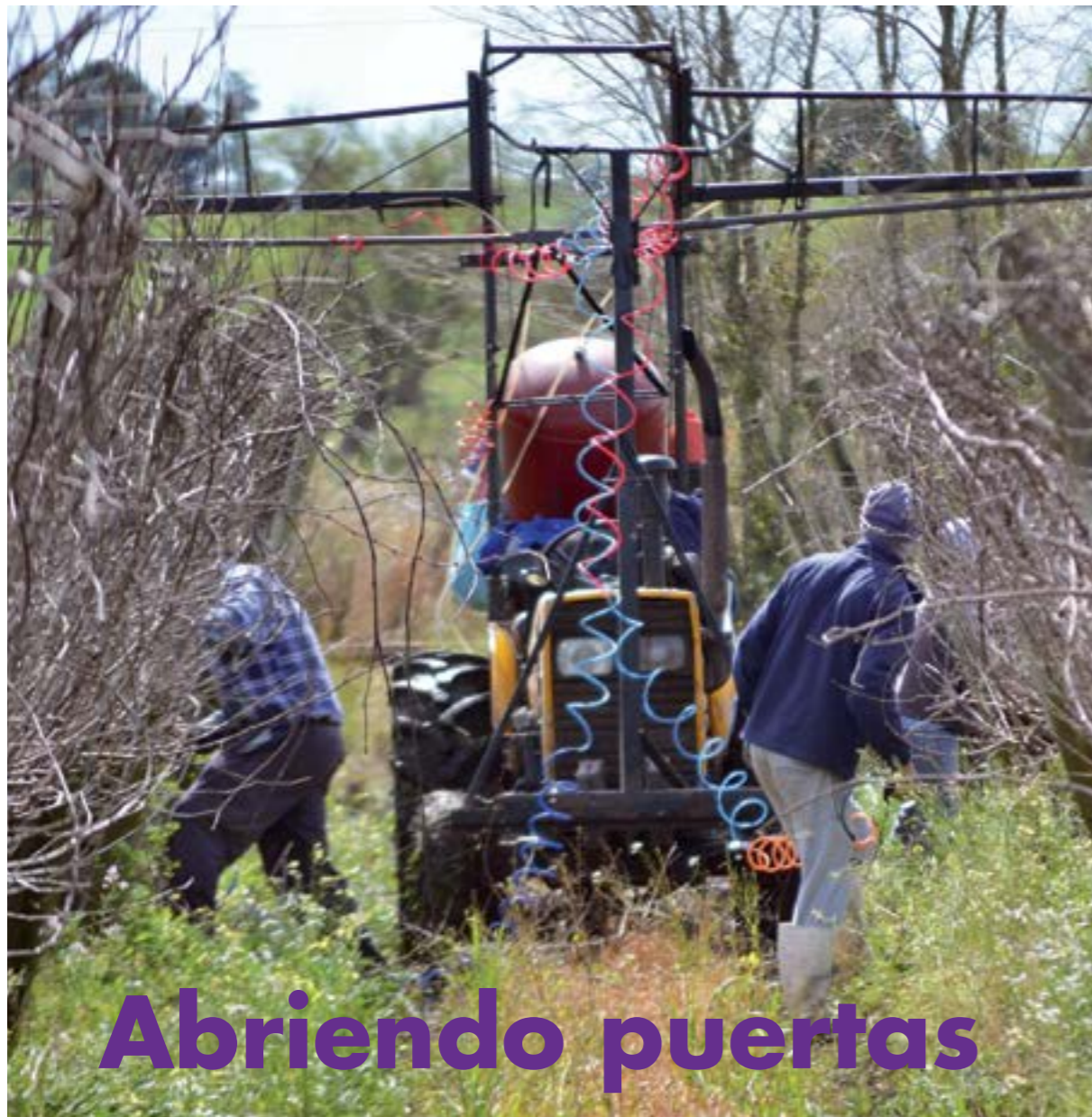
Trabajadores de Bodega Castillo Viejo

Nuestro primer gran objetivo es lograr la inclusión social de las personas privadas de libertad, de los y las liberados/as y de sus familiares, quienes, directa o indirectamente (más lo primero, que lo segundo) se ven perjudicados y son muchas veces "salpicados"