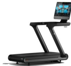
Recalled Peloton Tread+ treadmill

La Comisión para la Seguridad de los Productos de Consumo de EE.UU. (CPSC) anuncia que Peloton Interactive Inc. de Nueva York, ha acordado pagar una multa civil de 19.065.000 dólares. El acuerdo resuelve las acusaciones de la CPSC de que Peloton, a sabiendas, no informó inmediatamente a la CPSC, como exige la ley, de que su cinta de correr Tread+ contenía un defecto que podía crear un peligro sustancial del producto y creaba un riesgo irrazonable de lesiones graves a los consumidores. La sanción civil también resuelve las acusaciones de que Peloton distribuyó a sabiendas cintas de correr retiradas del mercado, infringiendo la Ley de Seguridad de los Productos de Consumo (CPSA).