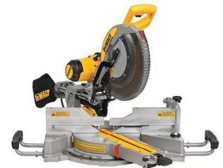
Sierra Ingletadora DEWALT Modelo DWS780.

SIERRA INGLETADORA MARCA DEWALT Modelo DWS780.