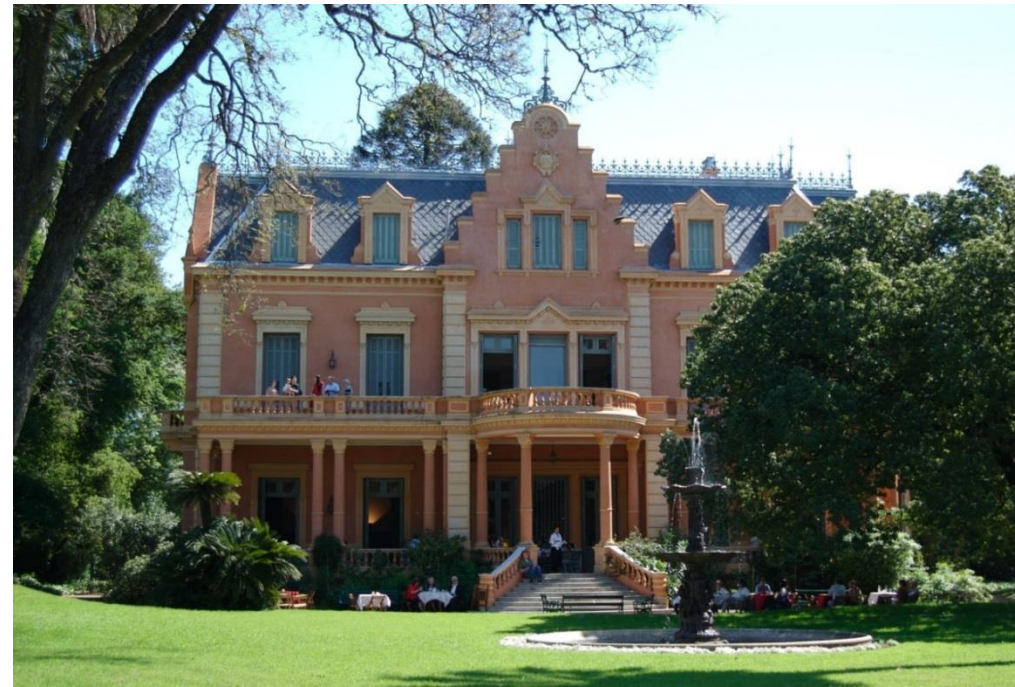
Observatorio UNESCO Villa Ocampo, Argentina