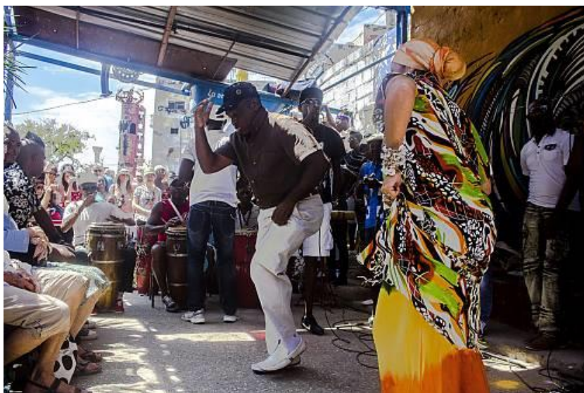
Merengue, República Dominicana. PCI desde 2016