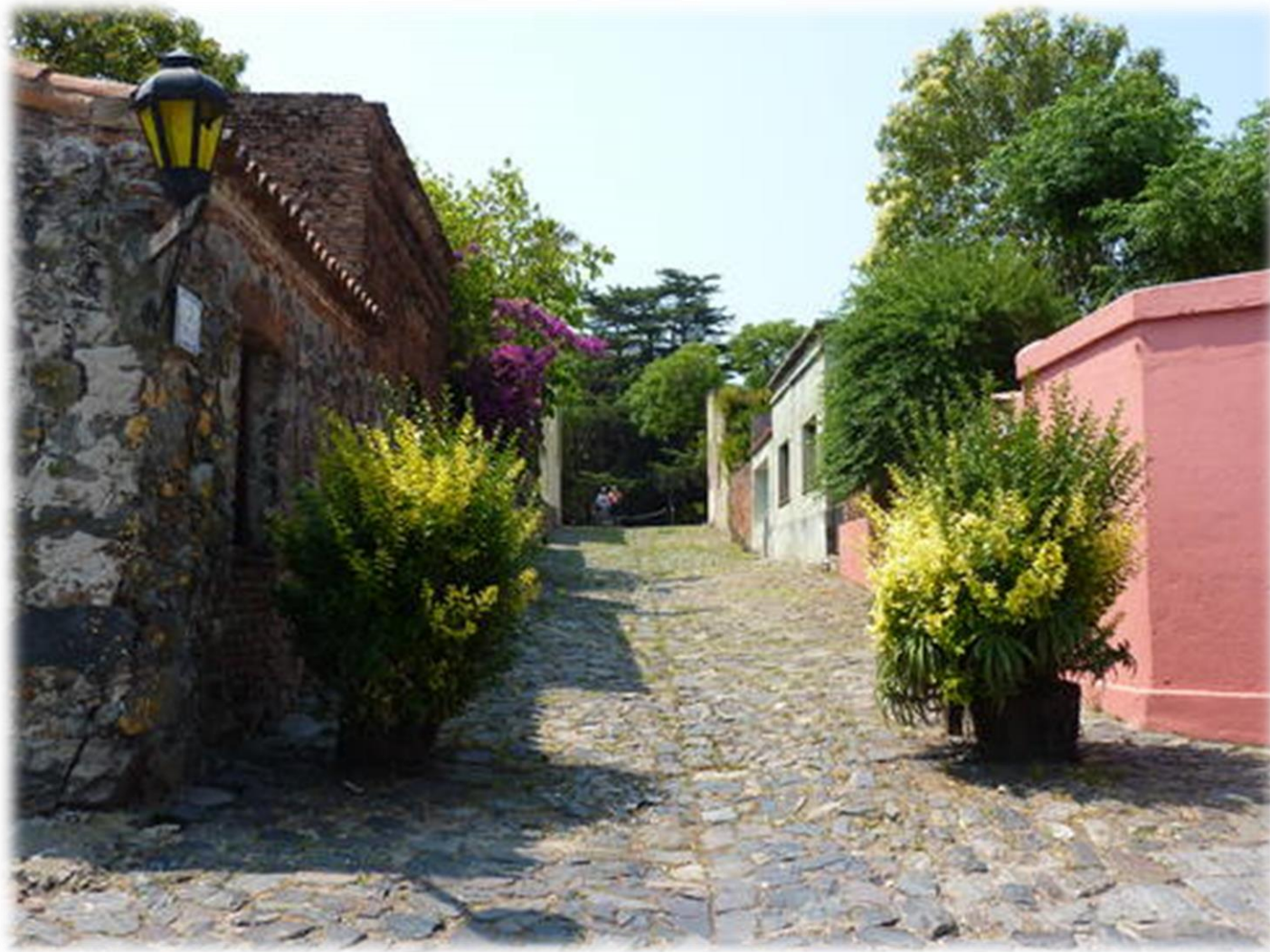
Barrio histórico de Colonia del Sacramento, Uruguay