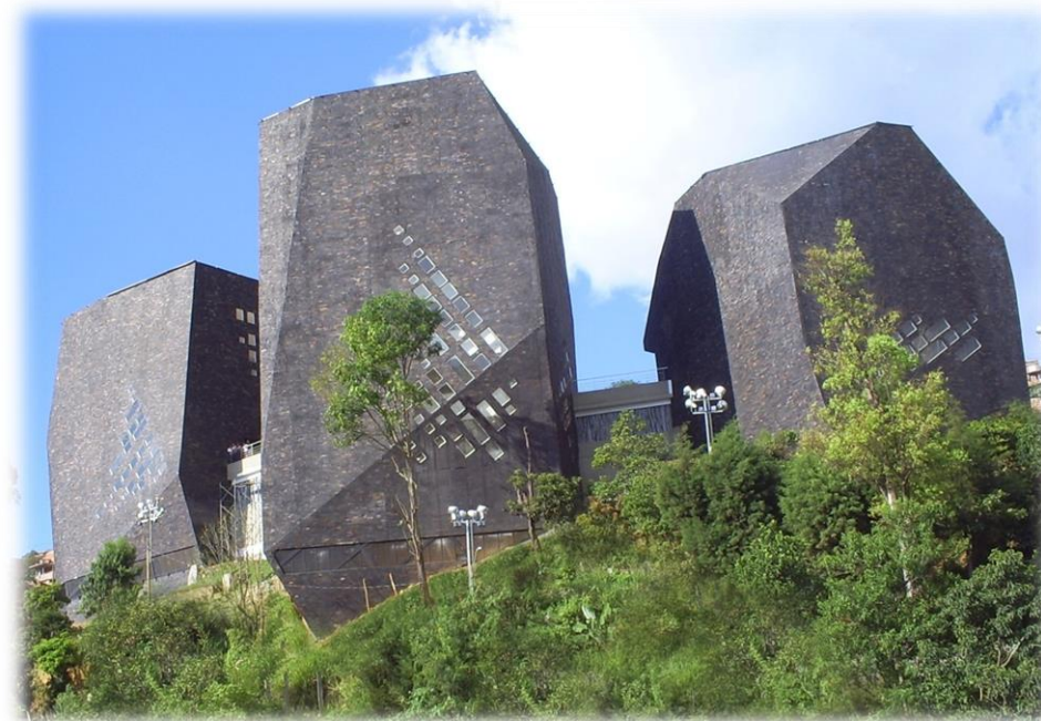
Parques Bibliotecas de Medellín