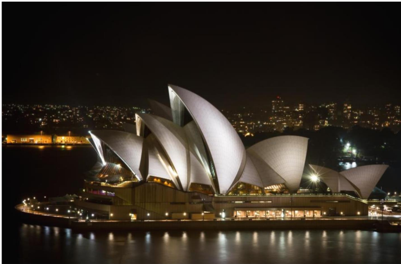
La ópera de Sidney, Australia