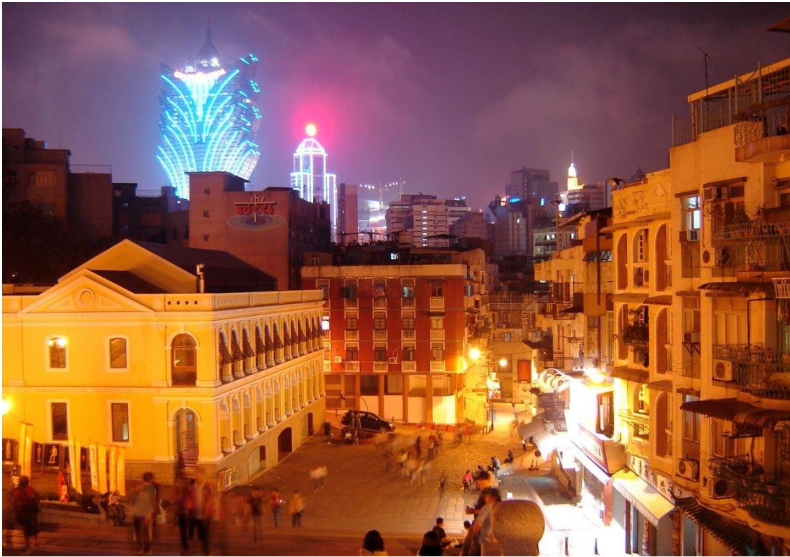
Hotel Lisboa, Centro histórico Macau