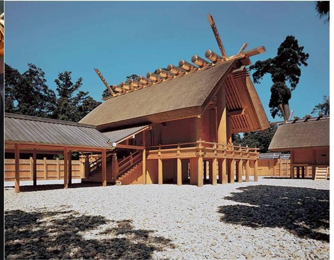
Templo de Ise, la ceremonia del renacimiento Shikinen Sengu