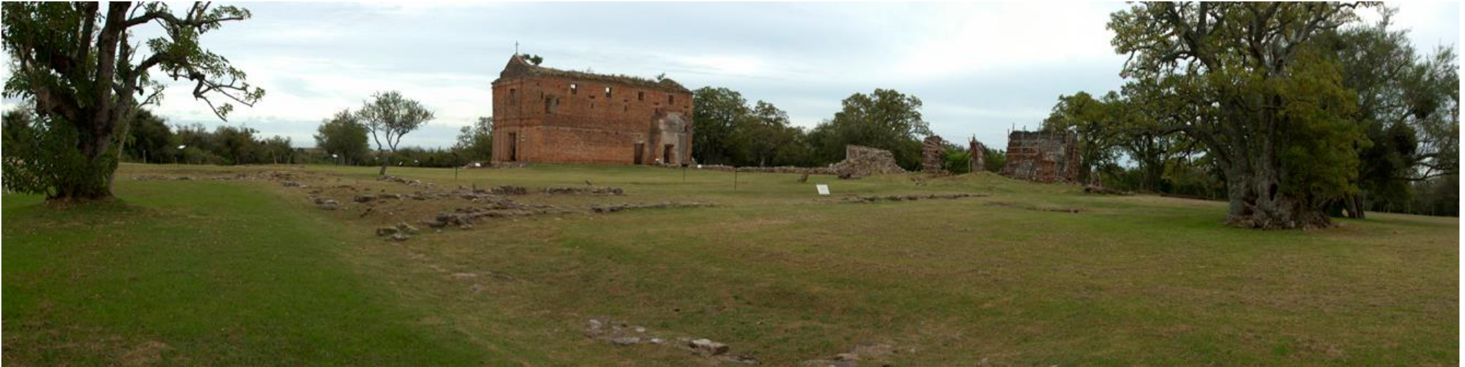
Calera de las Huérfanas, Colonia