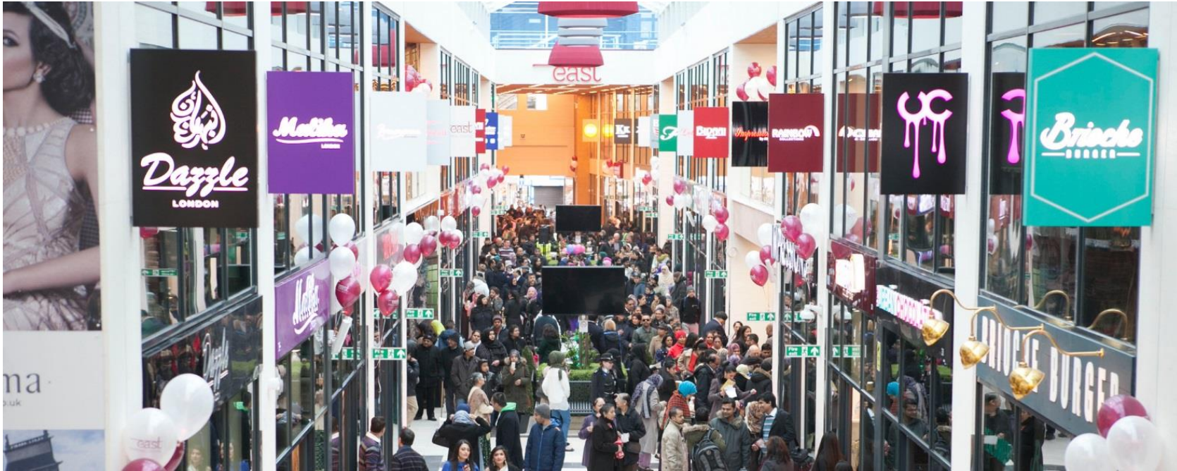
Los “No lugares”, Marc Augé