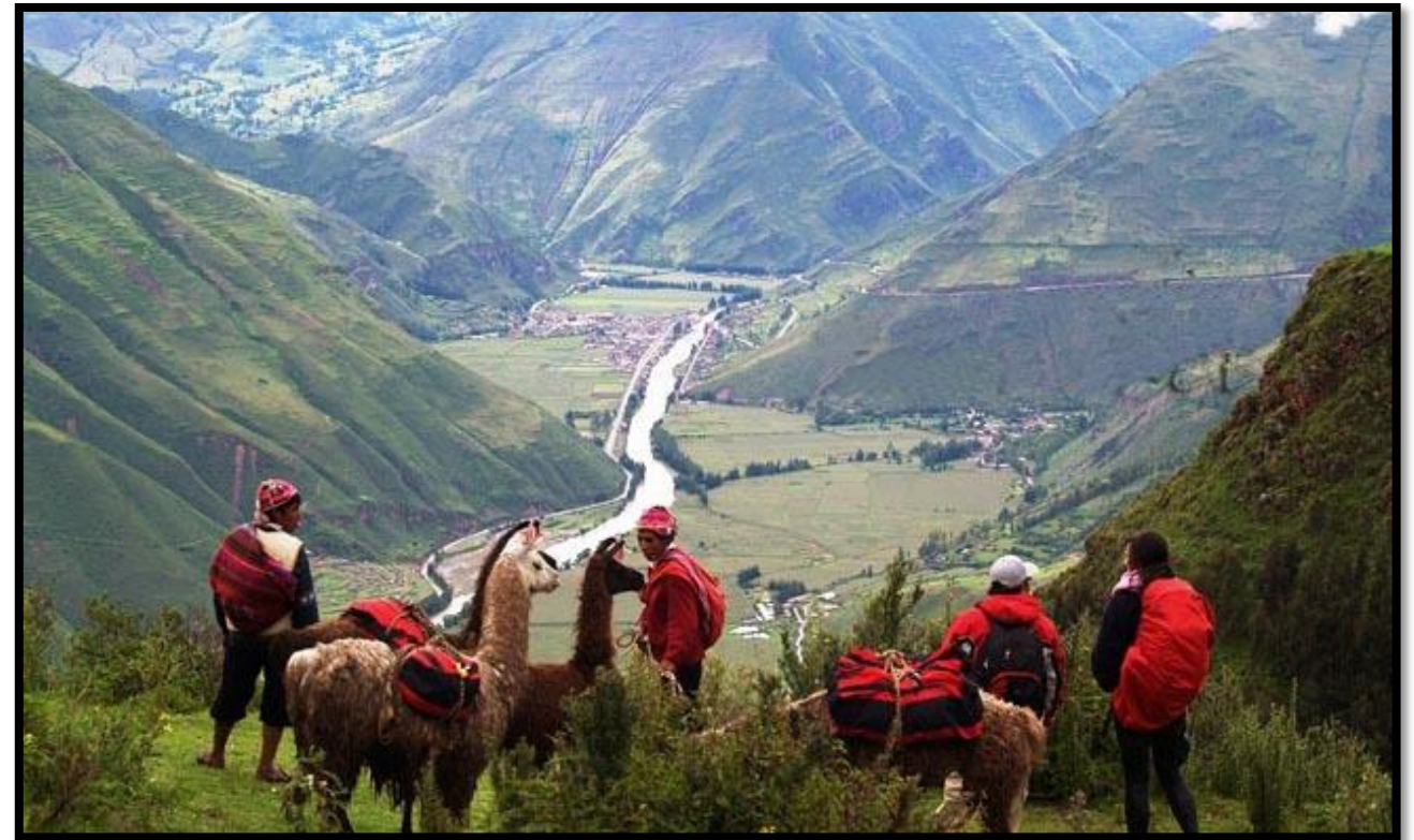
Qhapaq Ñan o Camino Principal Andino Patrimonio común de Argentina, Bolivia, Chile, Colombia, Ecuador y Perú