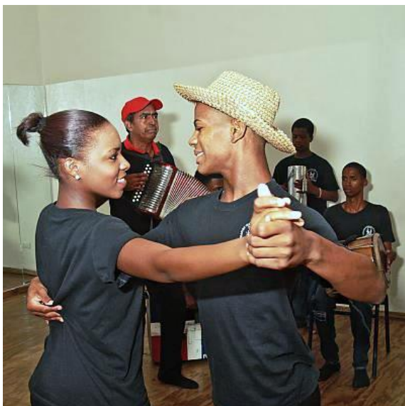
Rumba cubana, PCI desde 2016