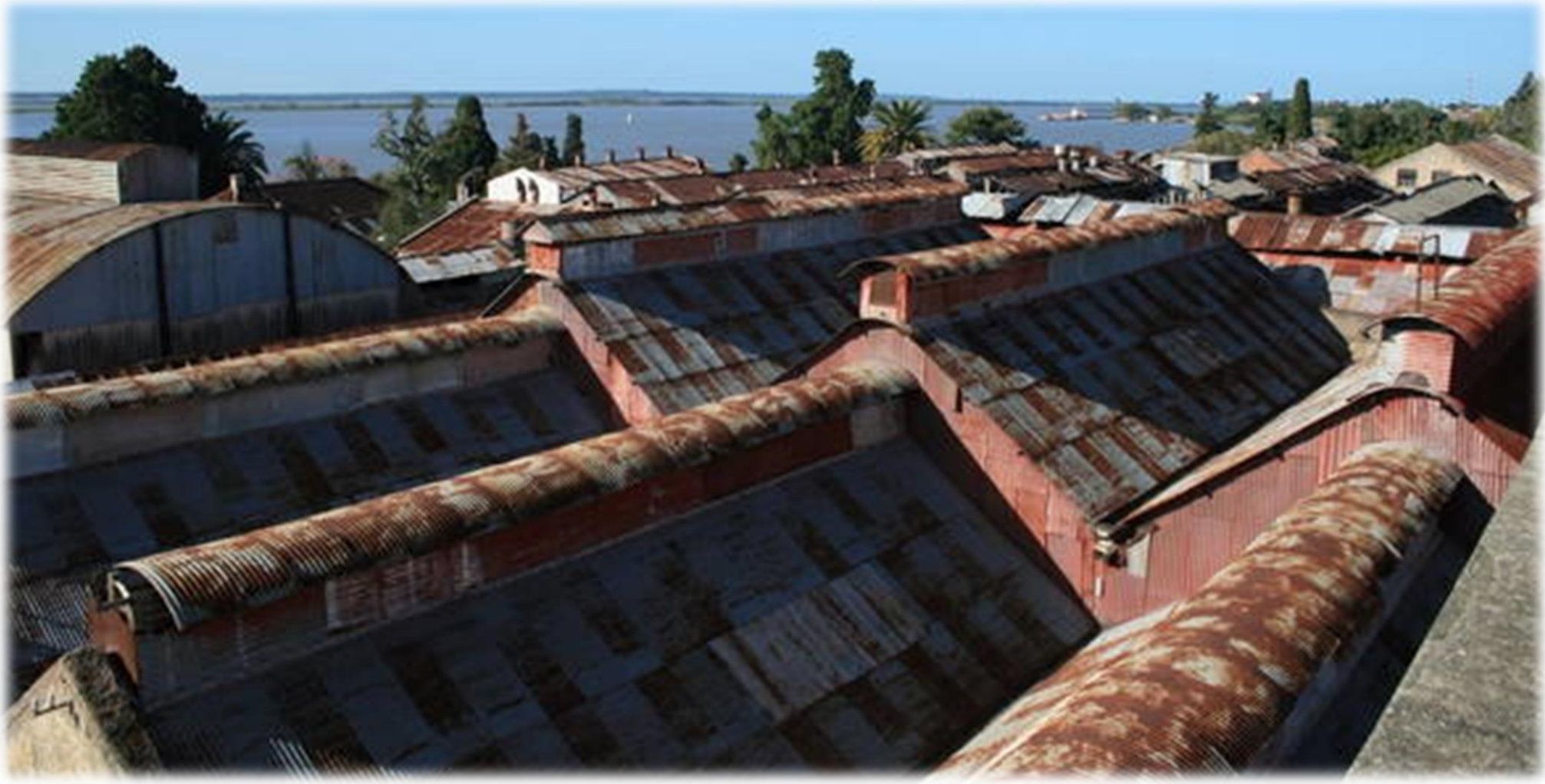
Paisaje Cultural Industrial de Fray Bentos