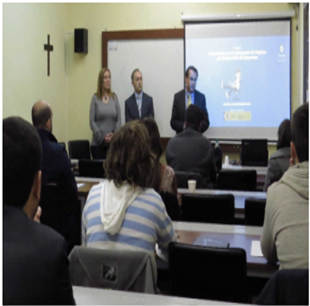
Instante de la presentación del curso

Cerca de una treintena de empresarios ya han comenzado con el programa enmarcado en la Escuela de Emprendedores.