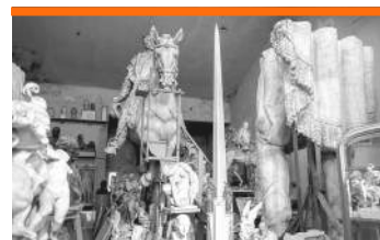
6 TALLER DE JOSÉ LUIS ZORRILLA DE SAN MARTÍN JOSÉ LUIS ZORRILLA DE SAN MARTÍN 96