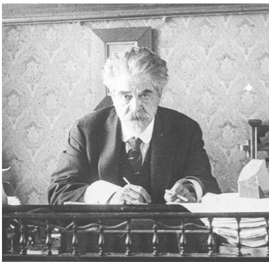
○ JUAN ZORRILLA DE SAN MARTÍN (1855 — 1931)