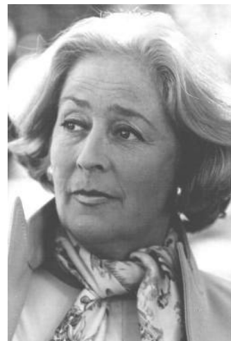
○ CHINA ZORRILLA (1922 — 2014)