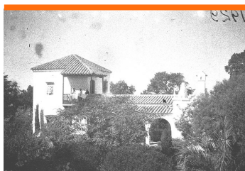
1 PUNTA CARRETAS SHOPPING (EXESTABLECIMIENTO PENITENCIARIO) JOSÉ ELLAURI 350

Tres generaciones de una misma familia, destacadas en literatura, artes plásticas y artes escénicas, en distintos momentos históricos, bien merecen invitar a un recorrido por "un extremo de Montevideo", al decir del mismo Don Juan Zorrilla de San Martín.