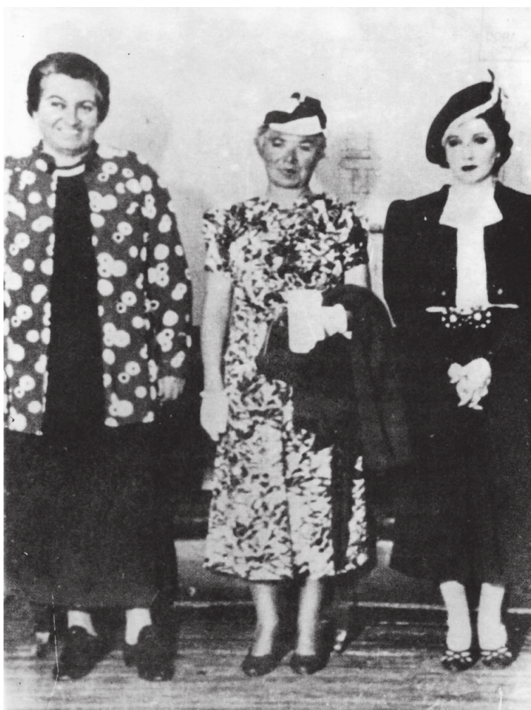
Juana de Ibarbourou con Gabriela Mistral y Alfonsina Storni (1938).