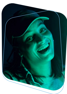
Clara Di Donato

Cantautora y compositora, conocida artísticamente como ClaraOscuro. Realizó la Tecnicatura en Interpretación del Instituto de Música de la Facultad de Artes (Udelar). Seleccionada en los Fondos Regionales para la Cultura 2022, desarrolla su carrera como tallerista de música para infancias y actualmente graba su segundo EP y su primer álbum.