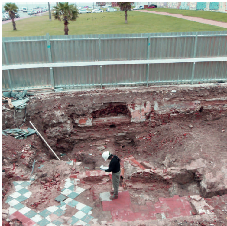
Figura 12. Vista interna de la fachada F2 y diversos restos murarios y pavimentos de la vivienda n° 1 registrada en el Catastro Capurro, esquina Zabala y Santa Teresa.

transformaciones a lo largo del tiempo (desde las variantes más antiguas 1780-1830, a las más recientes de inicios del siglo XX) debido a la disminución gradual de la superficie de los terrenos y a cambios en el contexto histórico cultural. Las casas estándar, erigidas por maestros constructores, fundamentalmente italianos eran de una sola planta, posteriormente, gracias al empleo de nuevas tecnologías y materiales de construcción, se hizo frecuente la casa estándar de dos plantas (Figueredo, 1999; IdD, 2002; Rodríguez, 1996).