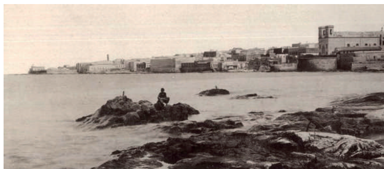
Figura 4. “Vista costa (Sud) - Capilla de los Ingleses”