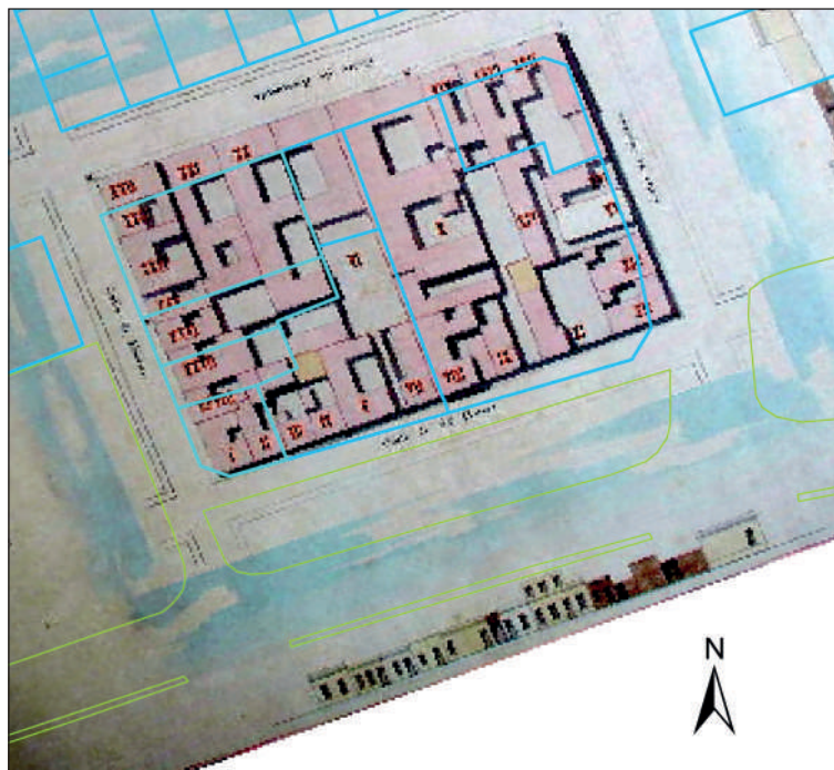
Figura 3. Superposición de manzana 68 del Catastro Capurro 1867 con parcelario actual. SIG Depto. Arqueología

la prostitución ... infame calle para patentizar el desenfreno y la vileza ... Santa Teresa entera está en ebullición ... Pasando las tapias del Convento de las Hermanas de San Vicente de Paul, oyese entre Zabala y Alzáibar, los ecos de los bailoteos de La Estrella partida, las jaranas ...” (Sierra, 1896:5), extendiéndose el relato hasta la última cuadra de la calle Alzáibar.