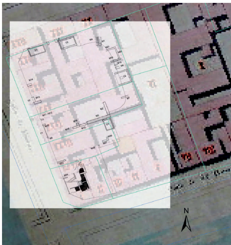
Figura 9. Superposición de la Planta de las estructuras arqueológicas, relevamiento 2015, con parcelario actual y con manzana 68 del Catastro Capurro 1867. SIG Depto. Arqueología.

En lo que respecta a la dinámica urbana, resulta importante mencionar que se encontró evidencia arqueológica de la pronunciada pendiente hacia el sur, de la manzana, en el siglo XIX. Se encuentra testimoniada en la gran diferencia de cotas de nivel, entre los remanentes hallados al norte con los del sur del predio. Al norte se presentaban sólo cisternas y cimientos, y al sur, además de cisternas y cimientos; por debajo del actual nivel de la vereda permanecían pavimentos, muros y fachadas con vanos. Estos testimonios nos muestran episodios de relleno que suavizaron la pendiente de la calle y vereda hacia el sur, producto de elevar el nivel de piso al construir la Rambla.