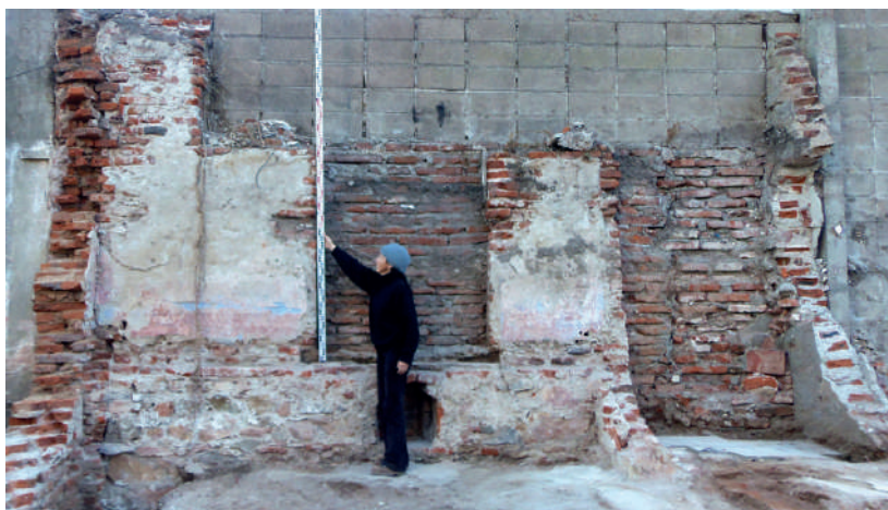
Figura 11. Vista interna de la fachada F1, vivienda n° 26 del Catastro Capurro, sobre la calle Zabala.

Podemos inferir que las viviendas que tenían la fachada F1 y F2, por el tipo de materiales de construcción, la disposición de los vanos y aberturas de respiración, los muros asociados y la superposición cartográfica, eran construcciones del tipo “viviendas standard”. Esta tipología edilicia es la más difundida durante la segunda mitad del siglo XIX y la primera del XX en Montevideo, constituyendo un subgrupo del tipo “casa patio”.