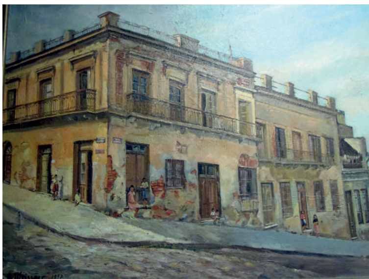
Figura 6. “Zabala esquina Reconquista”, óleo H. Meissner, 1957. Fuente: L3/179/4 Colección Museo Histórico Cabildo de Montevideo. Intendencia de Montevideo.

En 1999, se desarrolla la obra de reacondicionamiento del Hotel Columbia Palace NH ubicado entre las calles Carlos A. Miles, Misiones, Treinta y Tres y Reconquista (manzana