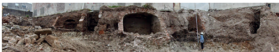
Figura 7. Vista este del predio, mostrando la afectación de la obra a los restos de la vivienda n° 20 del Catastro Capurro.

Señalamos asimismo el registro de un área de acumulación de desechos domésticos, caracterizado como basurero a cielo abierto, ubicado temporalmente en la transición colonia-república, conformado por diversidad de materiales en vidrio, loza, cerámica, metal, la