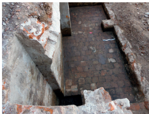
Figura 13. Vista de la planta de la cisterna C1.

El pozo de decantación de la cisterna C1, contenía un relleno constituido por un sedimento arenoso muy húmedo, con material cultural en buen estado de conservación (cuero, vidrio, metal, óseo, loza,