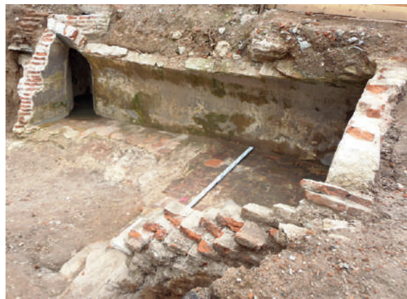
Figura 14. Vista general de la cisterna C2, seccionada longitudinalmente, obsérvese el pozo de decantación, ducto y abertura del brocal adosados al ángulo NE.

A través del estudio cartográfico y espacial, concluimos que C1 es una cisterna de aljibe ubicada en el único patio de la vivienda número 23 registrada en el catastro Capurro como “Casa de familia”. Era una casa de dos plantas, con fachada de acceso lateral (al norte), una ventana en planta baja y dos ventanas y balcón en la planta alta. Es la segunda construcción por la calle Zabala desde la esquina de Reconquista, que se puede observar en el óleo “Esquina de Zabala y Reconquista”, de H. Meissner (1957) en donde se representan dos niñas sentadas en el umbral de la puerta de entrada (ver figura 6). Además identificamos un muro (M5) probablemente correspondiente al muro medianero entre la vivienda 23 y la 21 (por calle Reconquista). Al tener dos plantas, esta vivienda, podemos inferir que pertenece a la segunda época de construcción del tipo estándar.