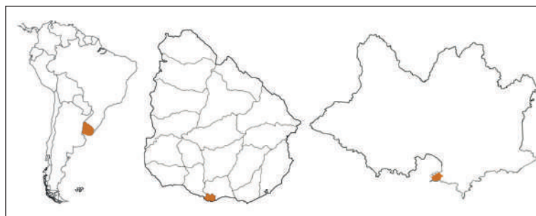
Figura 1. Ubicación de Uruguay, de Montevideo y de Ciudad Vieja.

La actual trama urbana de Ciudad Vieja se configura en el siglo XVIII, la estructura del asentamiento corresponde al modelo de ciudad territorio de los lineamientos impuestos por las Leyes de Indias. Las primeras “quadras” se proyectan en la ribera del puerto, costa norte de la