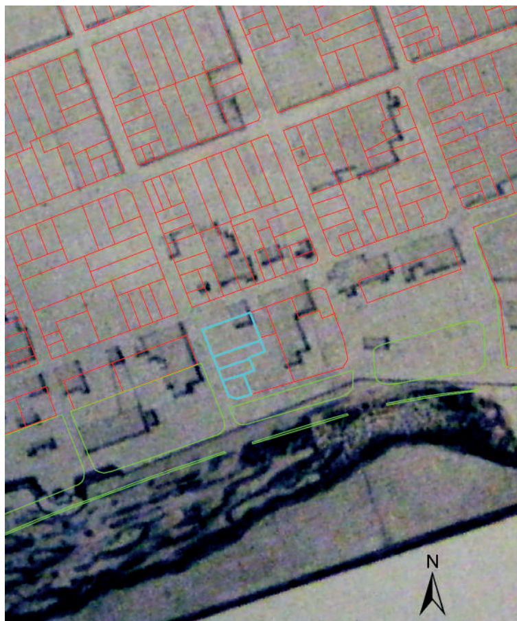
Figura 8. Superposición de “Plano de la Plaza o Ciudad de Sn. Felipe de Montevideo”, 1797, J. García Martínez de Cáceres (en Travieso 1937:46) con parcelario actual. SIG Depto. Arqueología

mayoría fragmentados, de los cuales un alto porcentaje ensambla, datados entre fines del siglo XVIII y mediados del XIX.