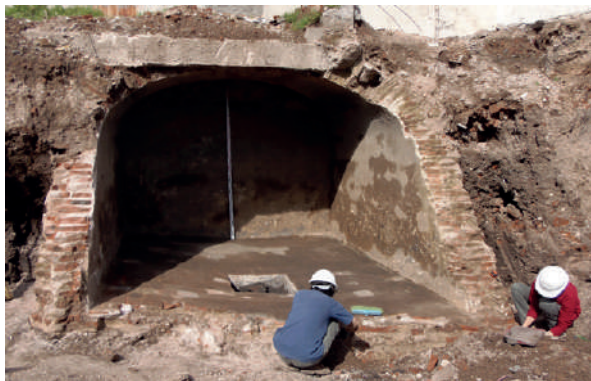
Figura 15. Vista de la cisterna C3, seccionada transversalmente, con pozo de decantación al centro.

patios, fondo, fachada de acceso lateral al este y dos ventanas; siendo la segunda vivienda por la calle Reconquista desde la esquina con calle Zabala. Por otro lado, reconocemos de la misma vivienda cuatro muros (M2, 3, 15 y 16) correspondientes a la medianera sur y a los ángulos SE y SW.