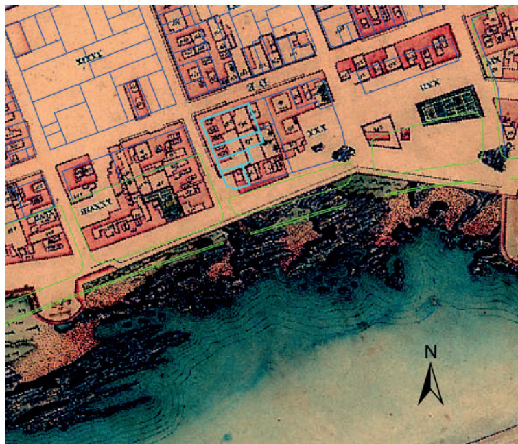
Figura 2. Superposición de “Plano da Cidade de Montevideo” J.Carvalho 1820, con amanzanamiento actual. Se señala padrones de estudio. SIG Depto. Arqueología

calle Santa Teresa también llamada Recinto (la cual fue el límite sur de la manzana en estudio).