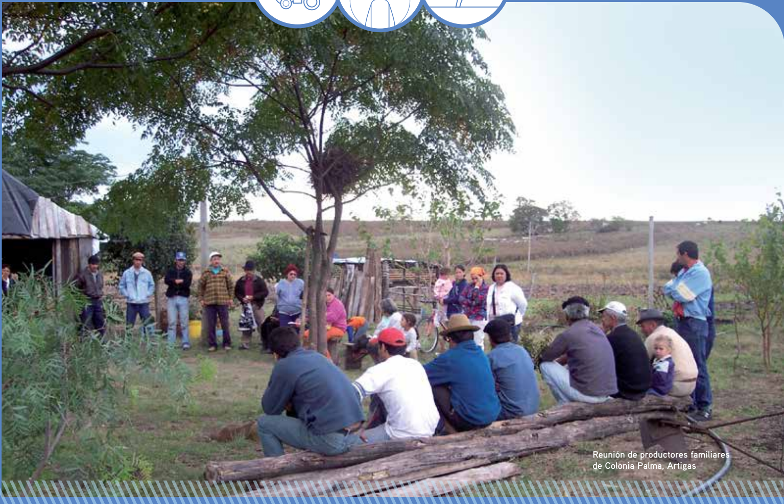
Reunión de productores familiares de Colonia Palma, Artigas