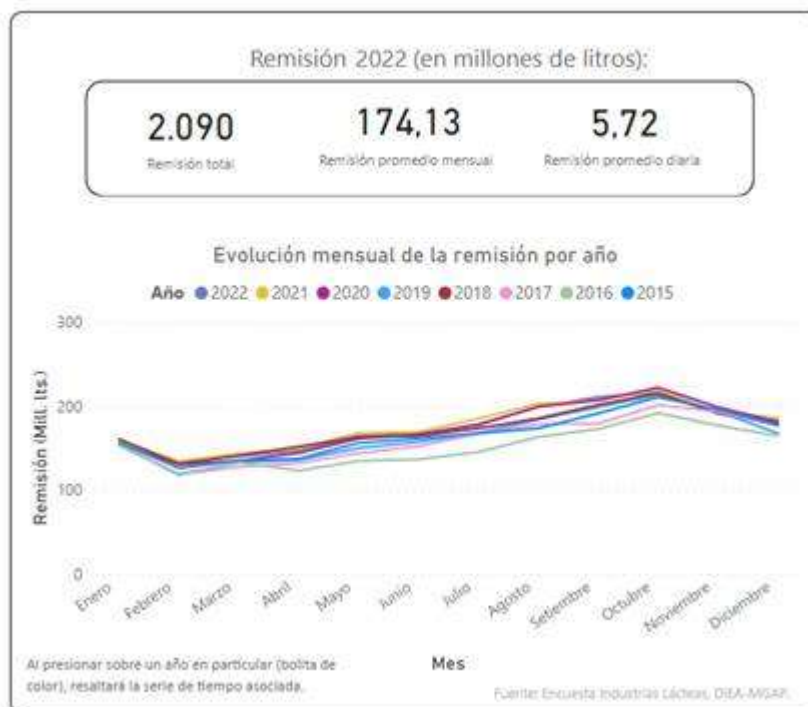
Imagen 1. Entrada de leche a plantas industriales en millones de litros, remisión promedio mensual y diaria, año 2022. Gráfico1 Evolución mensual de la remisión. Período 2015 – 2022.