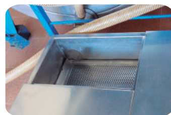
Filtro en fosa