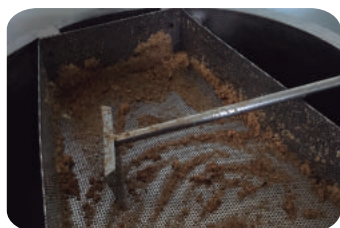
Filtro en fosa y espátula de acero inoxidable