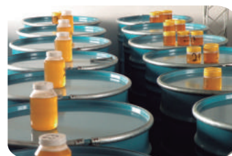
Aspecto traslúcido de miel bien filtrada respetando así las buenas prácticas en las salas de extracción de miel.