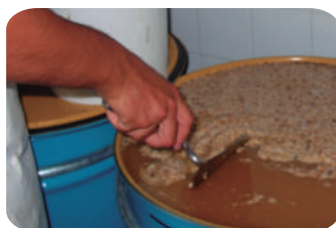
Espumado, retiro de restos groseros en superficie del tambor utilizando espátula limpia y de acero inoxidable y colocando el material de espumado en balde calidad alimentaria