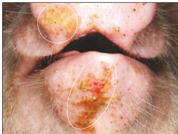
Erosión en el labio inferior y hocico con fibrina