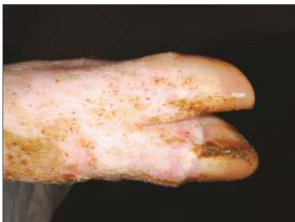
Banda coronaria pálida