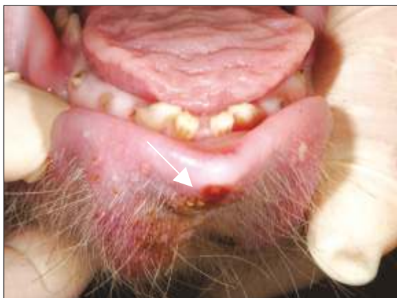
Erosión de la punta del labio inferior