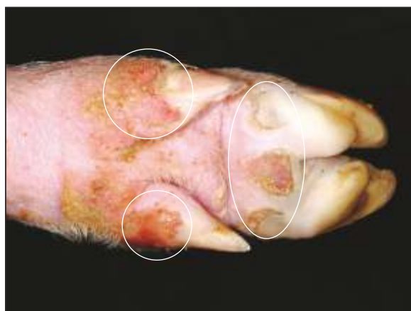
Ulceraciones y erosiones provenientes de vesículas lesionadas