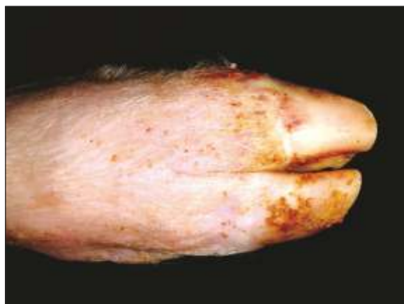
Banda coronaria pálida