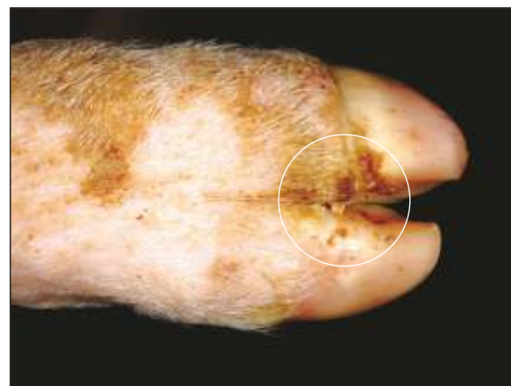
Necrosis de la banda coronaria con costras