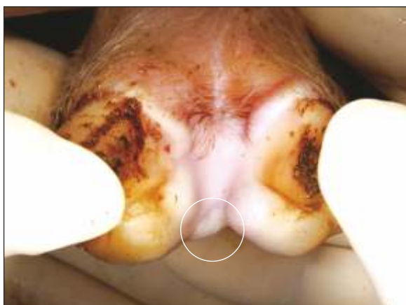
Vesícula en el área interdigital