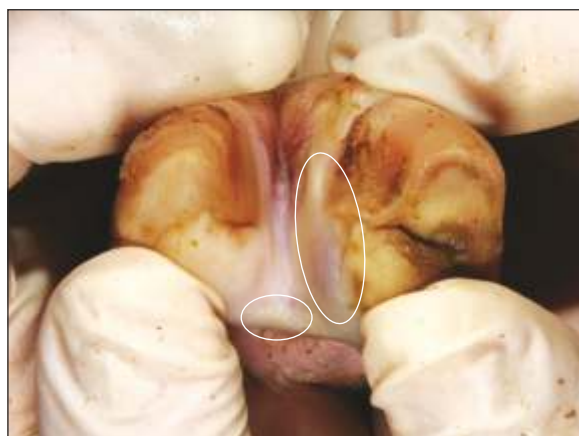
Vesícula en área interdigital y banda coronaria inflamada