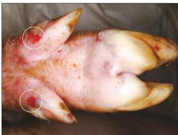
Vesículas en el área de apoyo de las pezuñas y vesículas lesionadas de las pezuñas accesorias