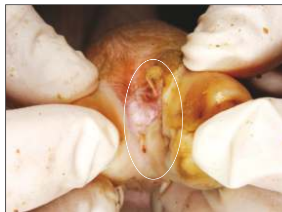
Ulceración interdigital en la banda coronaria