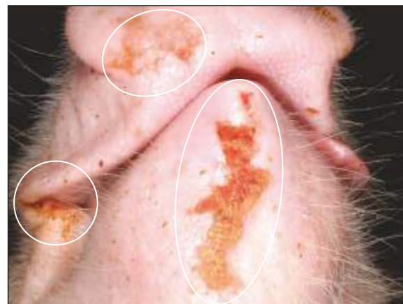
Lesiones cutáneas ulcerativas y erosivas en la mandíbula, parte inferior del hocico y comisuras unilaterales.