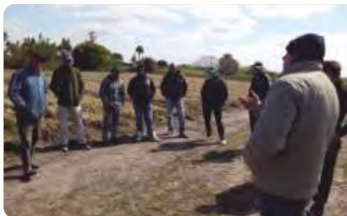
Actividad de intercambio sobre los avances del proyecto en cultivo de cebolla, San Jacinto octubre de 2015.

VINCULACIÓN CON OTRAS POLÍTICAS DE LA DGDR: Registro de Productores Familiares y Propuestas para el Fortalecimiento Institucional.