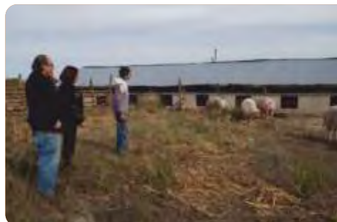
Arribo de las cerdas de INIA a los predios donde se instalaron núcleos de selección de línea materna. Julio 2015

VINCULACIÓN CON OTRAS POLÍTICAS DE LA DGDR: Registro de Productores Familiares, Propuestas para el Fortalecimiento Institucional, Producción Familiar Integral y Sustentable, y es posible que se vincule con la convocatoria “Más Valor a la Producción Familiar”.