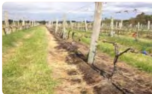
Parcela demostrativa de uno de los predios en donde se evaluará la metodología propuesta.

VINCULACIÓN CON OTRAS POLÍTICAS DE LA DGDR: Registro de Productores Familiares, Propuestas para el Fortalecimiento Institucional, Producción Familiar Integral y Sustentable y posiblemente con la convocatoria “Más Valor para la Producción Familiar”