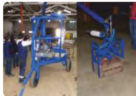
Izquierda: aspecto general del modelo desarrollado en las instalaciones del PTI. Derecha: pruebas del brazo mecánico utilizando cajones

VINCULACIÓN CON OTRAS POLÍTICAS DE LA DGDR: Registro de Productores Familiares, Propuestas para el Fortalecimiento Institucional y Producción Familiar Integral y Sustentable.