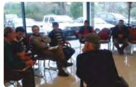
Primera actividad general de intercambio con participación de apicultores de distintas zonas del país. La Estanzuela, Julio de 2015.

VINCULACIÓN CON OTRAS POLÍTICAS DE LA DGDR: Registro de Productores Familiares, Propuestas para el Fortalecimiento Institucional y Producción Familiar Integral y Sustentable.