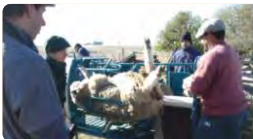
Primera actividad de campo del Proyecto (Flores, junio de 2015)

VINCULACIÓN CON OTRAS POLÍTICAS DE LA DGDR: Registro de Productores Familiares, Propuestas para el Fortalecimiento Institucional, Producción Familiar Integral y Sustentable, Planes Ovinos.