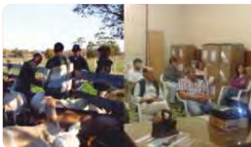
Extracción de muestras para muestreo parasitológico en un predio caprino de Canelones y actividad de presentación de resultados del muestreo parasitológico en Salto.

VINCULACIÓN CON OTRAS POLÍTICAS DE LA DGDR: Registro de Productores Familiares, Propuestas para el Fortalecimiento Institucional y Producción Familiar Integral y Sustentable.