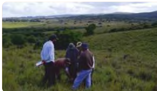
Vecinos de la SFR Ruta 109 evalúan un portero de la zona durante jornada del proyecto (Rocha, marzo de 2015)

VINCULACIÓN CON OTRAS POLÍTICAS DE LA DGDR: Registro de Productores Familiares, Propuestas para el Fortalecimiento Institucional, Ganaderos Familiares y Cambio Climático, Producción Familiar Integral y Sustentable.