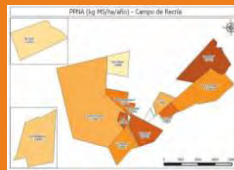
Valor promedio por potrero de productividad primaria neta anual desde 2000 a 2014.

VINCULACIÓN CON OTRAS POLÍTICAS DE LA DGDR: Registro de Productores Familiares, Propuestas para el Fortalecimiento Institucional, Ganaderos Familiares y Cambio Climático, Producción Familiar Integral y Sustentable.