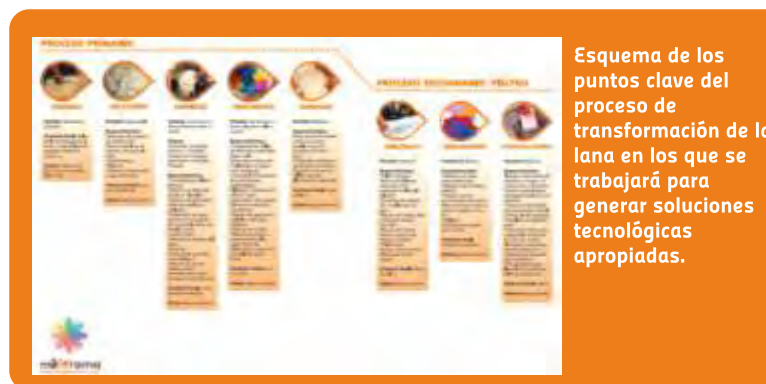
Esquema de los puntos clave del proceso de transformación de la lana en los que se trabajará para generar soluciones tecnológicas apropiadas.

VINCULACIÓN CON OTRAS POLÍTICAS DE LA DGDR: Registro de Productores Familiares, Propuestas para el Fortalecimiento Institucional, Planes Ovinos.