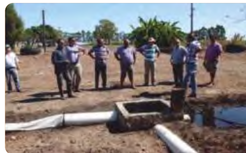
Productores y técnicos en una actividad del proyecto en Colonia España, Bella Unión, otoño 2015.

VINCULACIÓN CON OTRAS POLÍTICAS DE LA DGDR: Registro de Productores Familiares y Propuestas para el Fortalecimiento Institucional.