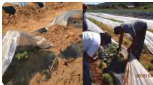
Cultivos de sandía con dos manejos diferentes en uno de los predios demostrativos. Octubre (izquierda), Noviembre (derecha).

VINCULACIÓN CON OTRAS POLÍTICAS DE LA DGDR: Registro de Productores Familiares, Propuestas para el Fortalecimiento Institucional.