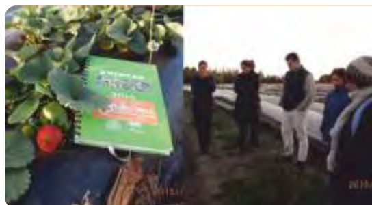
Visita a los ensayos en predios donde se instalaron los ensayos, julio de 2015.

VINCULACIÓN CON OTRAS POLÍTICAS DE LA DGDR: Registro de Productores Familiares, Propuestas para el Fortalecimiento Institucional, Producción Familiar Integral y Sustentable y posiblemente con la convocatoria “Más Valor para la Producción Familiar”