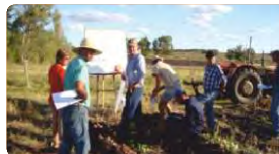
Actividad de evaluación de cultivares de boniato, otoño de 2015.

VINCULACIÓN CON OTRAS POLÍTICAS DE LA DGDR: Registro de Productores Familiares y Propuestas de Fortalecimiento Institucional y Producción Familiar Integral y Sustentable.