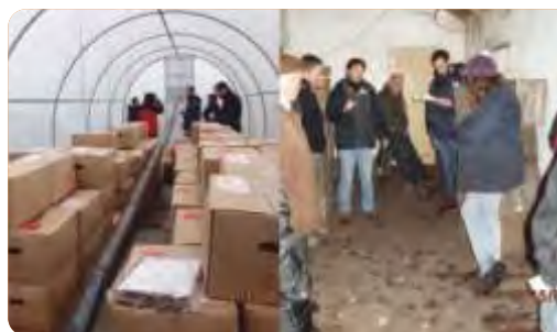
Jornada de intercambio visitando estructuras de conservación de semillas agámicas Sauce, San Antonio y Cerrillos, agosto de 2015.

VINCULACIÓN CON OTRAS POLÍTICAS DE LA DGDR: Registro de Productores Familiares y Producción Familiar Integral y Sustentable.