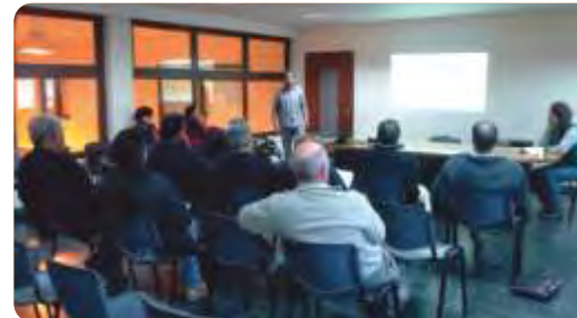
Taller realizado en la ciudad de Trinidad, mayo de 2015.

VINCULACIÓN CON OTRAS POLÍTICAS DE LA DGDR: Registro de Productores Familiares, Propuestas para el Fortalecimiento Institucional, Sistemas Productivos Agroforestales, Producción Familiar Integral y Sustentable, Ganaderos Familiares y Cambio Climático.