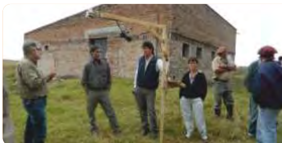
Primeras pruebas de sensores para medir la eficiencia en el uso de la radiación sobre campo natural (Paysandú, abril de 2015).

VINCULACIÓN CON OTRAS POLÍTICAS DE LA DGDR: Registro de Productores Familiares, Propuestas para el Fortalecimiento Institucional, Ganaderos Familiares y Cambio Climático, Producción Familiar Integral y Sustentable.