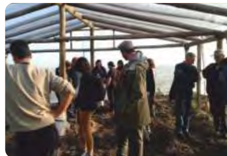
Primera actividad de intercambio entre productores de distintas zonas en el primer invernáculo con el sistema intercambiador de calor instalado. San Jacinto, octubre de 2015.

VINCULACIÓN CON OTRAS POLÍTICAS DE LA DGDR: Registro de Productores Familiares, Propuestas para el Fortalecimiento Institucional y Producción Familiar Integral y Sustentable.