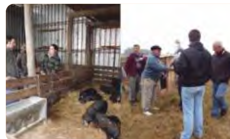
Recorrida por instalaciones de prueba del engorde de suinos en “cama profunda” en Facultad de Agronomía (Progreso) y en el predio del Sr. Guerrero (Toledo).

VINCULACIÓN CON OTRAS POLÍTICAS DE LA DGDR: Registro de Productores Familiares, Propuestas para el Fortalecimiento Institucional, Producción Familiar Integral y Sustentable, y es posible que se vincule con la convocatoria “Más Valor a la Producción Familiar”.