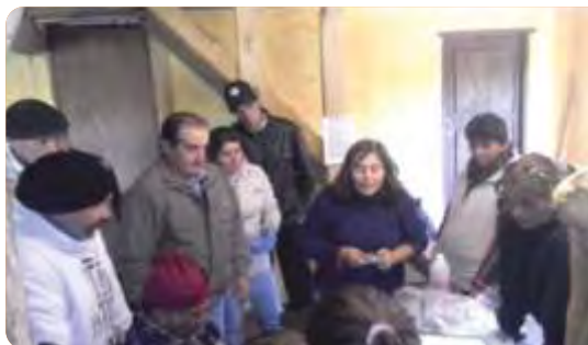
Primera jornada de capacitación: Entrenamiento en reproducción de hongos entomopatógenos patogénicos de garrapatas en las instalaciones de Bio-Uruguay, Rincón de la Aldea Tacuarembó.

VINCULACIÓN CON OTRAS POLÍTICAS DE LA DGDR: Registro de Productores Familiares, Propuestas para el Fortalecimiento Institucional, Propuestas para la Producción Lechera.