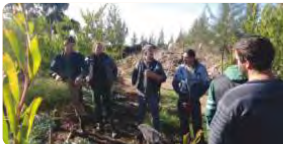
Visita a un SAFs maduro en el marco del proyecto. Agosto 2015.

VINCULACIÓN CON OTRAS POLÍTICAS DE DGDR: Registro de Productores Familiares, Propuestas para el Fortalecimiento Institucional.