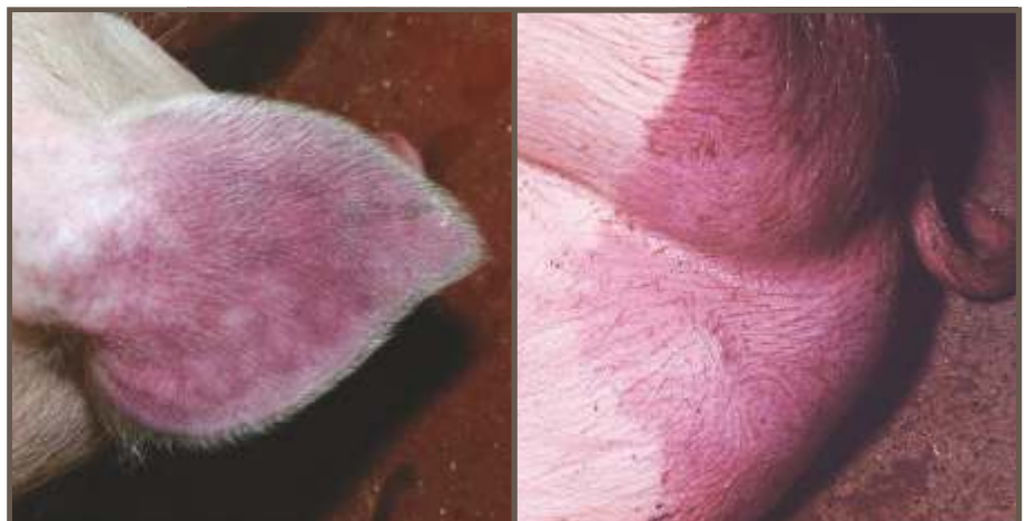
DECOLORACIÓN DE LA PIEL

Los cerdos infectados con PPA se asemejan a aquellos animales infectados con varias enfermedades domésticas o exóticas tales como, la porcina clásica (cólera porcino), síndrome respiratorio reproductivo porcino agudo (SRRP), síndrome dermatitis y nefropatía porcino (SNDP), erisipela, salmonelosis, actinobacilosis, infección de Haemophilus parasuis (enfermedad de Glasser) useudorabia. Cuando observe animales exhibiendo los signos clínicos mencionados arriba, sospeche de PPA y contacte a su médico veterinario.